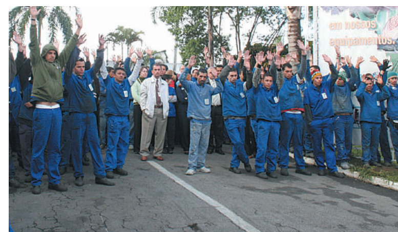
Companheiros na Bozza querem a garantia do pagamento da segunda parcela

"A proposta foi um avanço conquistado pelo pessoal pois era uma antiga rei-