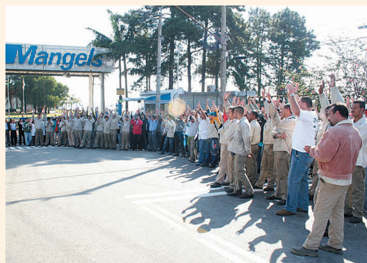
Empresa muda proposta e trabalhadores aprovam na Mangels