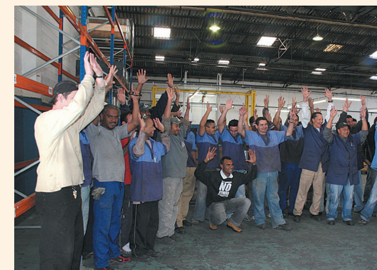
Pessoal na Tristar aprova PLR por unanimidade

Além da Ifer, os metalúrgicos aprovam acordos na Mangels e Tristar e rejeitam na Bozza. Página 2