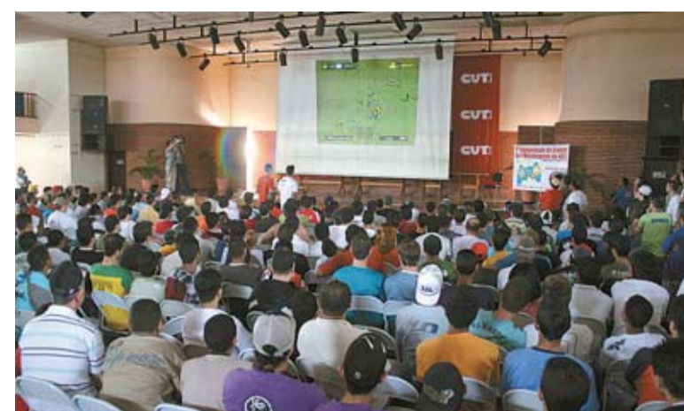
Competidores acompanham a partida que abriu o Campeonato de Games

A partir de amanhã a tabela do campeonato, com horários e dias das partidas, estará no portal do Sindicato, no endereço www.smabc.org.br