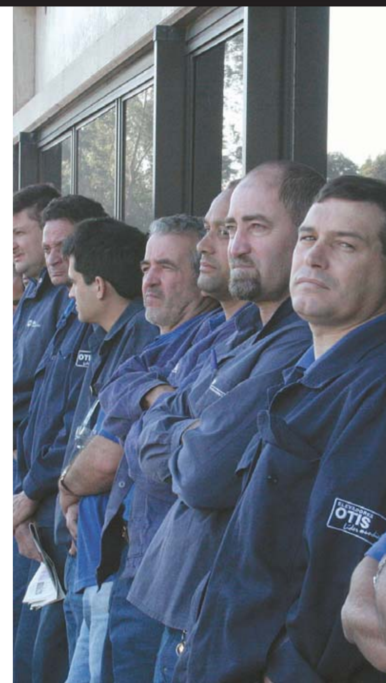
Companheiros na Otis, fábrica do grupo 9, em assembleia na última sexta-feira

A bancada dos trabalhadores rejeitou na mesa de negociações os 5% oferecidos pelos patrões do grupo 9. Com os demais grupos, as negociações prosseguem focadas nas cláusulas sociais. Página 3