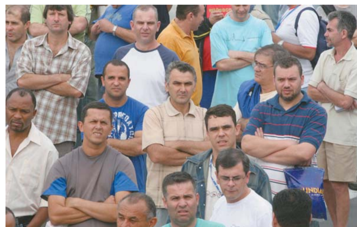
Trabalhadores na Volks participam de assembleia informativa sobre a campanha salarial, ontem à tarde