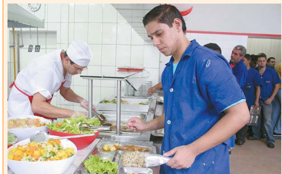
Trabalhador se serve na inauguração do restaurante na Metalúrgica Irene. Página 2