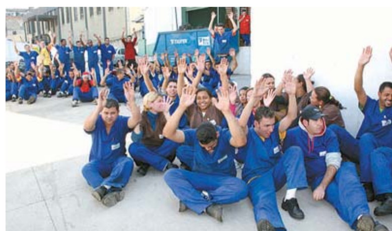
Pessoal na GRN aprova PLR com flexibilização das metas

paga dia 20 de setembro e a segunda dia 20 de março.