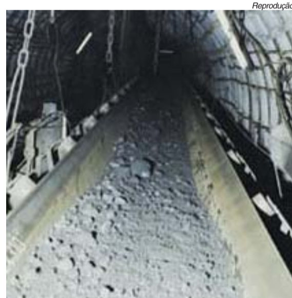
Minas chinesas são as mais perigosas do mundo

Os trabalhadores salvos ontem estavam presos desde domingo, quando foram sur-