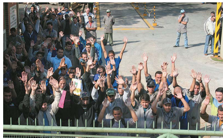
Depois de muita luta, trabalhadores aprovam proposta de restaurante

“Essa mobilização foi definitiva para chegarmos a