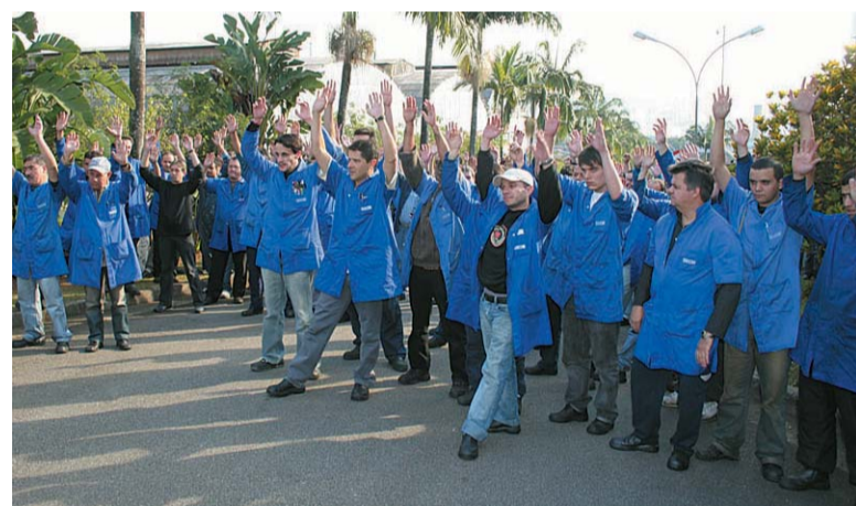
Mobilização garante pagamento da PLR na Grob

Segundo ele, a falta de regras e de transparência geravam descontentamentos e protestos, como no início