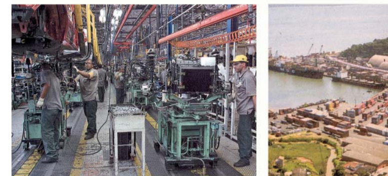
Aumentaram os investimentos, o emprego, os salários e as exportações