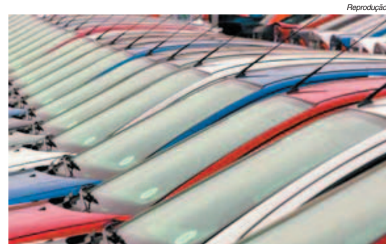
Montadoras batem um recorde atrás do outro na produção e vendas

A Fiat lidera o mercado, com 25,9% de participação, depois vem a Volks, com 23,3%, e a General Motors, com 21,2%.