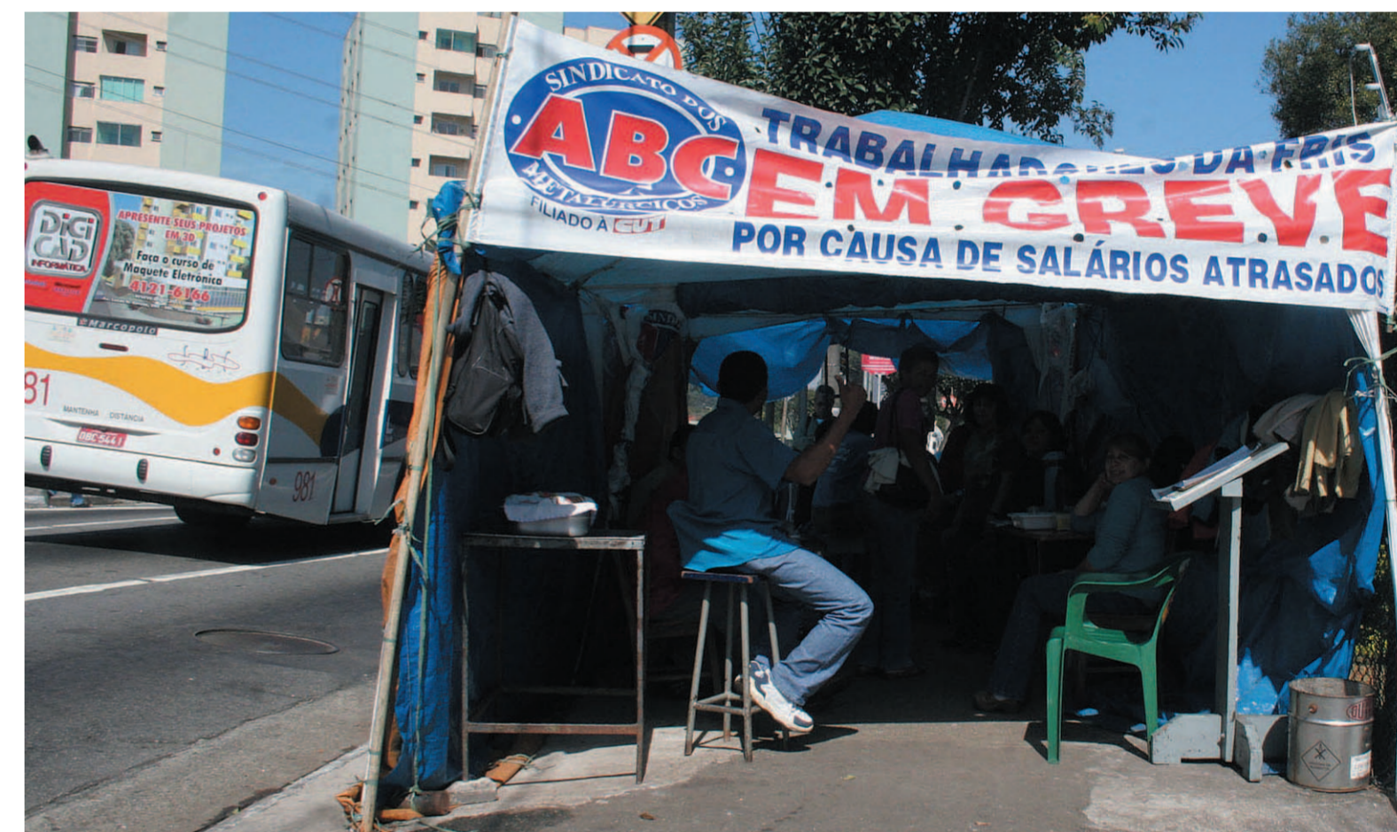
Trabalhadores na Fris permanecem ao lado da fábrica para guardar patrimônio e garantir direitos

Os companheiros na Fris Moldu Car, de São Bernardo, entraram em greve há 163 dias e estão acampados ao lado da fábrica, confiantes em recuperar seus direitos. A luta também reforça os laços de companheirismo e solidariedade. Página 3