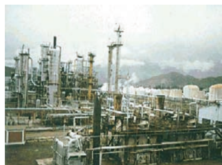
Produção industrial foi a que teve a maior participação para o crescimento do PIB

O consumo das famílias aumentou 1,5% no terceiro trimestre deste ano, influenciado pelo aumento real da massa salarial e da oferta de crédito para pessoas físicas.