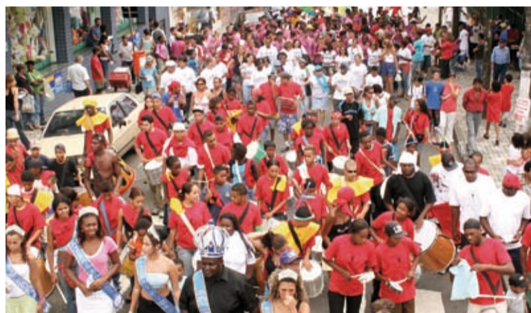
Direito é bom e eu gosto é o tema do bloco neste ano

Letra do Samba "Valeu Zumbi, salve Luther King