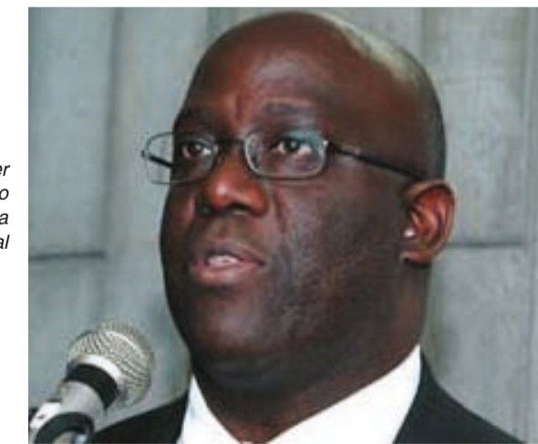
O ministro quer a aprovação do Estatuto da Igualdade Racial

Nesta semana estamos comemorando a publicação, no Diário Oficial de terça-feira, da lei que insere o estudo da história afro e indígena no ensino fundamental e médio