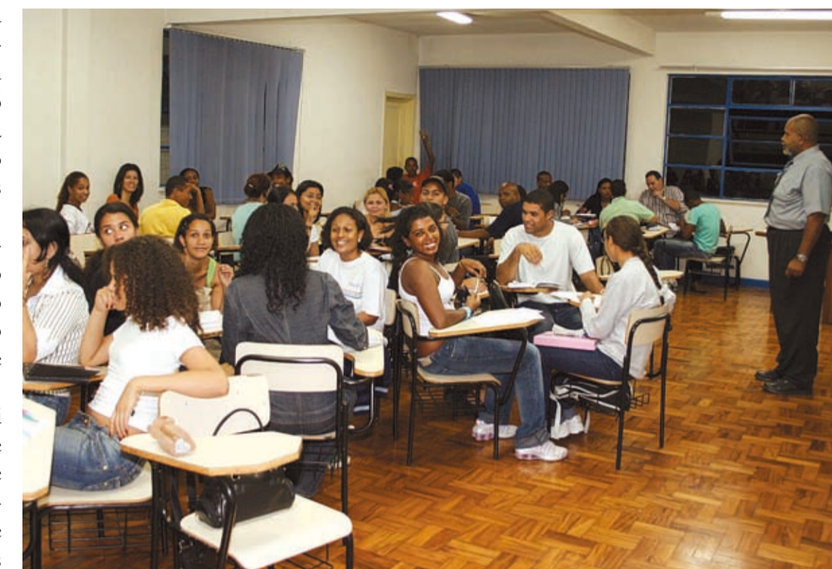
Na turma que se formou ontem, 90% dos alunos são afrodescendentes

Em ato que contou com a presença do presidente Lula, aconteceu ontem a colação de grau dos 126 alunos da primeira turma do curso de Administração da Universidade Zumbi dos Palmares.