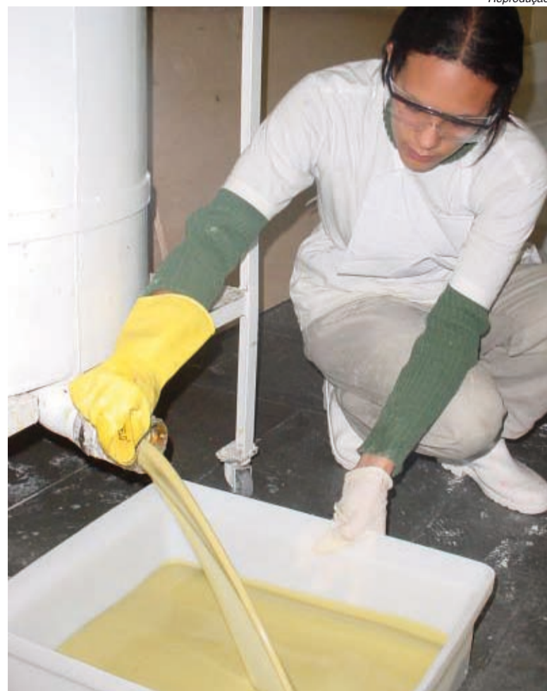
Produção de sabão em pedra com óleo vegetal barateia o produto final

Além de fazer bem ao meio ambiente, essas usinas proporcionam a jovens de comunidades carentes a primeira oportunidade de emprego, noções de cidadania e educação ambiental.