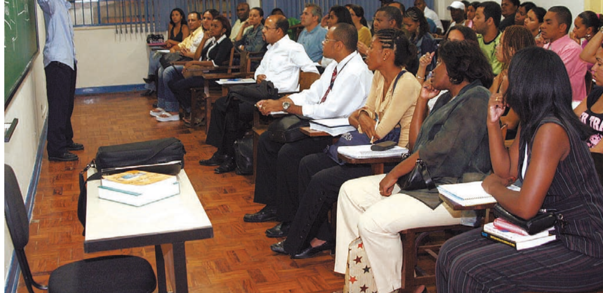
A instituição busca a excelência do ensino e a inclusão dos alunos no mercado de trabalho

Unipalmars é a única na América do Sul voltada para alunos negros. Ontem, ela fez a colação de grau dos 126 alunos da primeira turma do curso de Administração. Página 3