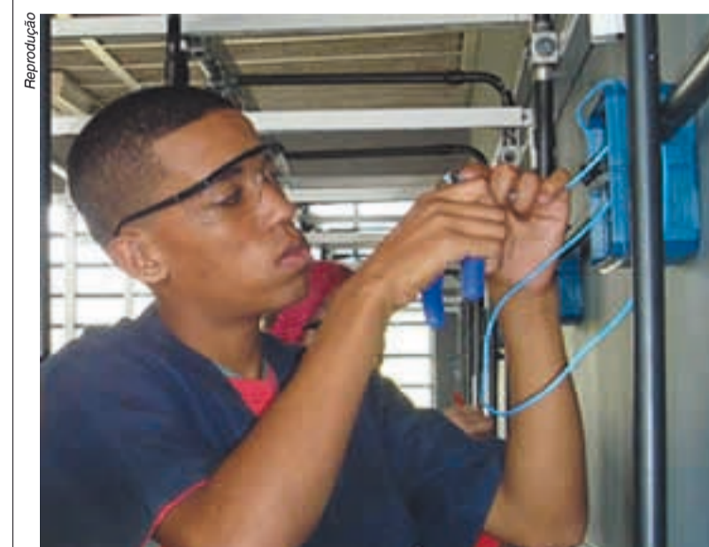
Pela proposta, um milhão de jovens seriam treinados todo ano

Governo propõe ensino profissionalizante grátis no Sistema S. Página 2