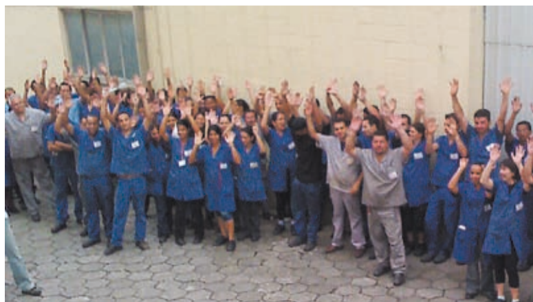
Pessoal na Backer conseguiu melhorar o acordo

Os 200 companheiros da Backer, de São Bernardo, aprovaram ontem proposta da PLR 2008. O pagamento obteve um reajuste maior do que o índice da inflação em relação ao ano passado.