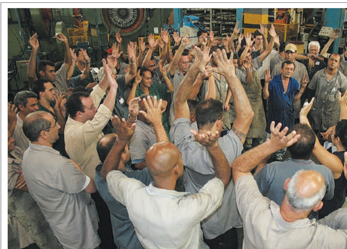
Assembleia dos companheiros na Miroal ontem à tarde