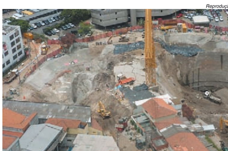
Contrato permitiu obra sem fiscalização de empresa externa

O relatório do IPT sobre o acidente da linha amarela do Metrô, que no ano passado matou sete pessoas, relacionou 11 fatores como causas e responsabilizou as empresas construtoras e o próprio Metrô.