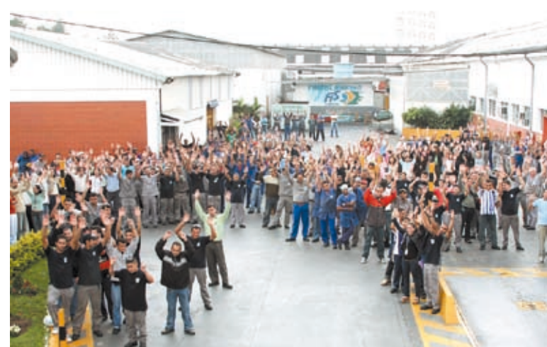
Depois de rejeitar primeira proposta, pessoal na Asbrasil foi à luta e fez acordo

Ele explica que dessa vez foi diferente, os companheiros decidiram recuperar as defasagens de valores em relação às fábricas do