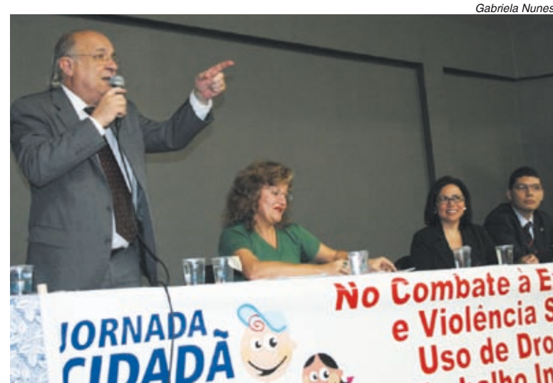
Combate ao trabalho infantil foi tema do Jornada Cidadã em Diadema

Na prática, a convenção da OIT significa dar competência além do Ministério do Trabalho, hoje principal responsável pela fiscalização. "Pode dar instrumentos ao Congresso brasileiro para penalizar aqueles que ainda insistem