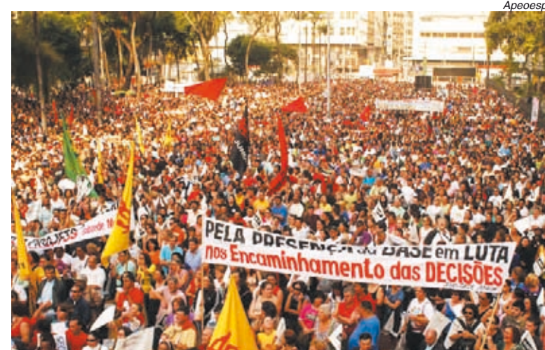
Além de salário, professores querem anular decreto de Serra

Os professores da rede pública estadual entraram em greve ontem.