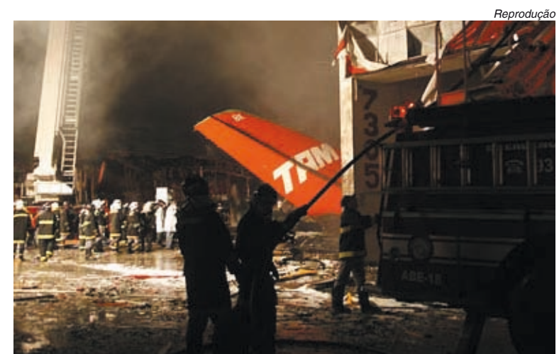
Causa do acidente ganhou pouco espaço na grande imprensa

Vocês se lembram qual o comportamento da mídia com o acidente da TAM, em julho do ano passado, quando morreram 199 pessoas? Todo mundo foi em cima do governo Lula, alegando que a pista de Congonhas não tinha as ranhuras suficientes para segurar as rodas do avião.