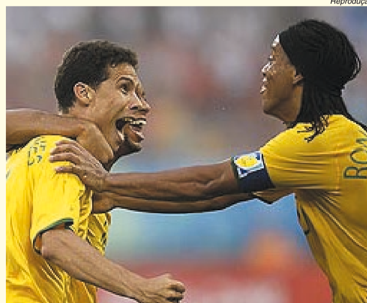
Hernanes comemora gol da vitória com Ronaldinho Gaúcho

O Brasil também espera fazer história na capital chinesa. Para isso, terá a maior delegação de todos os tempos, com 469 integrantes, 277 atletas (132 mulheres e 145 homens), em 32 modalidades.