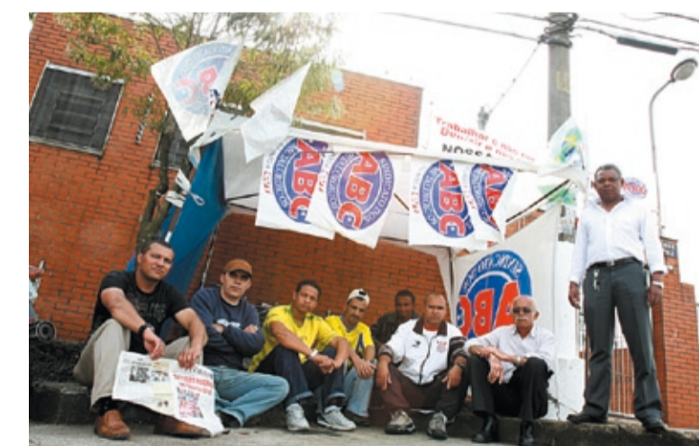
Companheiros na Bomfio se revezam no acampamento diante da fábrica

Sem salários regulares há mais de um ano, os companheiros na Bomfio, de Diadema, montaram acampamento na fábrica na segunda-feira, depois que 25 trabalhadores foram demitidos.