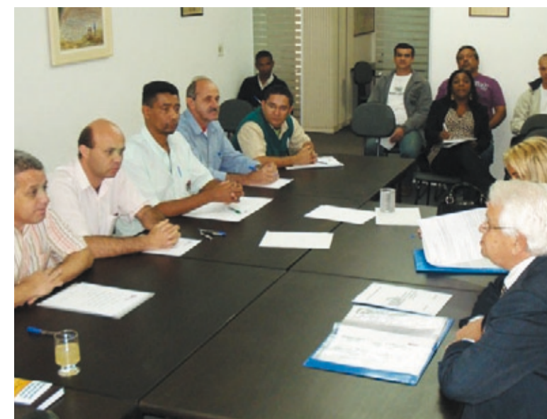
Na primeira negociação, metalúrgicos exigem valorização dos pisos

Esse é o grupo que tem o menor piso entre os demais. O valor na primeira faixa (fabricas até 100 trabalhadores) é R$ 607,20. Nos demais grupos, os pisos nas primeiras faixas variam de R$ 641,00 a R$ 685,00. "É muito grande a diferença e precisamos corrigir essa distorção", afirmou Da-