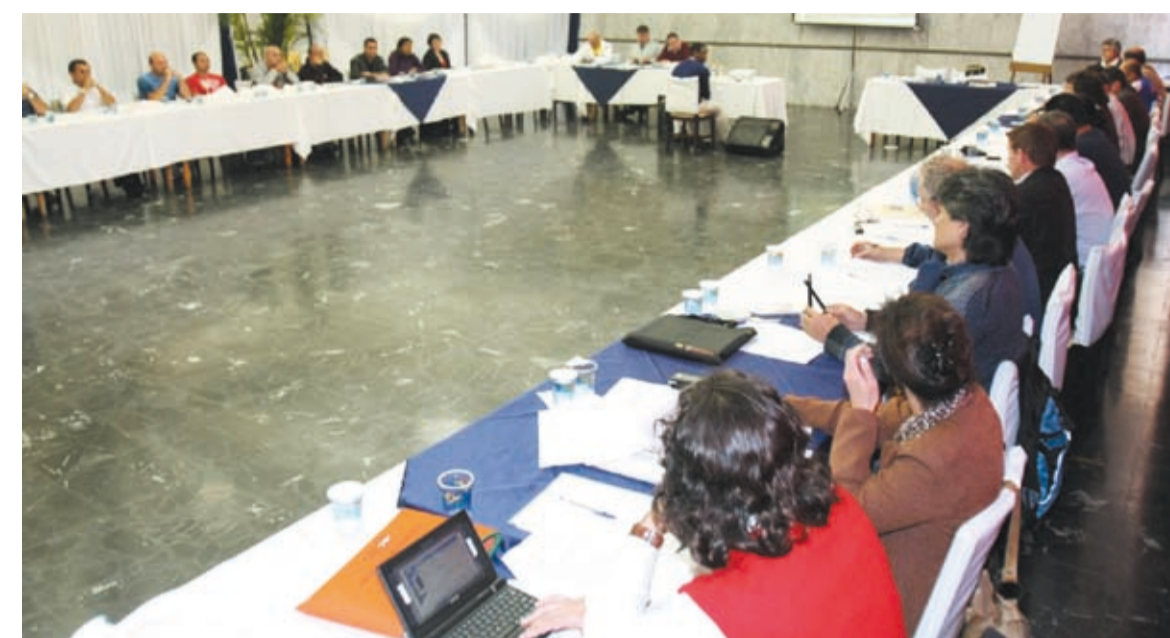
Seminário da diretoria definiu os temas para debate e quer a categoria envolvida na definição dos rumos do Sindicato

“Vamos levar o debate para dentro da fábrica, pois pretendemos oferecer a todos os metalúrgicos a oportunidade de participação. Outro motivo é que queremos fazer deste Congresso um marco dos 50 anos do Sindicato”, explicou. A entidade completa meio século