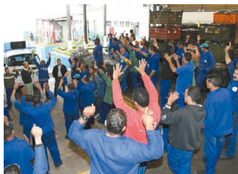
Trabalhadores na Injecta aceitam proposta negociada pelo Sindicato