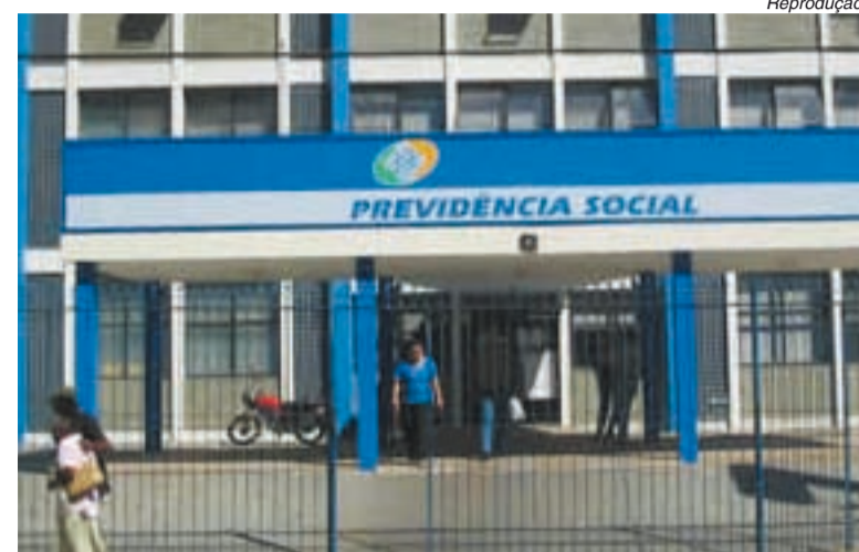
Cobertura previdenciária e social é a maior da história

buintes aumenta de forma contínua desde 2002, quando eram quase 31 milhões.