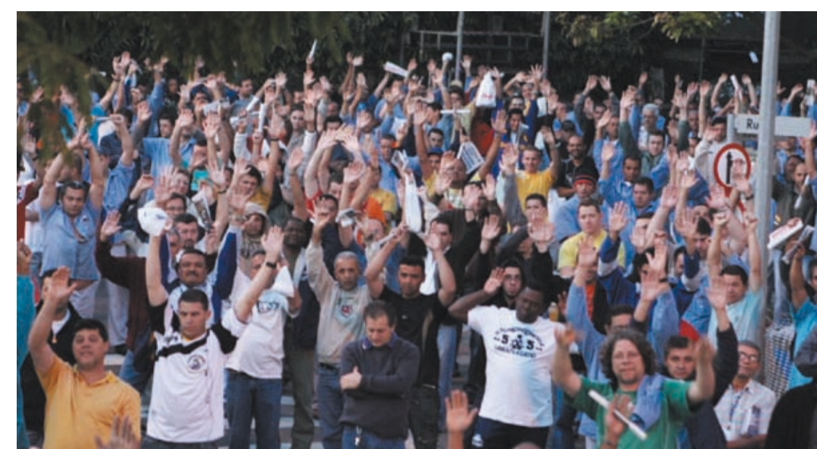
Na Volks, assembleias nas entradas de turnos retardaram a produção em uma hora

campanha salarial a categoria acreditava que seria fácil chegar a um acordo, as últimas rodadas de negociação mostraram que só com muita mobilização e luta chegaremos a um bom re-