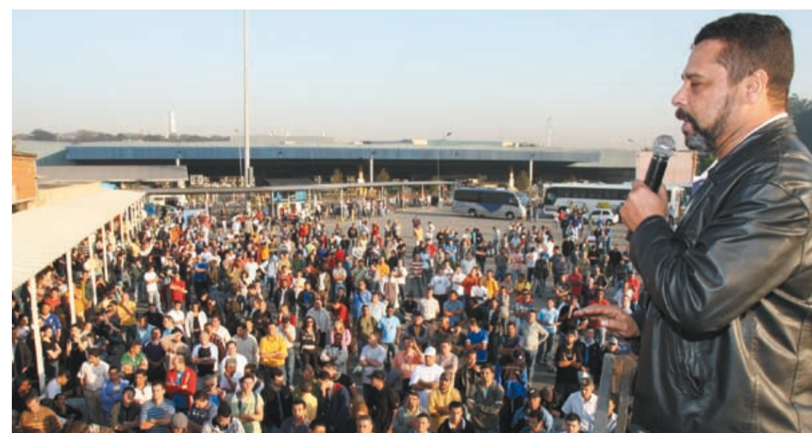
Trabalhadores na Ford decidiram que, sem acordo, é greve na segunda-feira

O pessoal na Ford também cruzou os braços ontem de manhã e definiu, por unanimidade, que se a proposta patronal não for aprovada na assembleia geral que acontece amanhã, entram em greve a partir de segunda-feira.