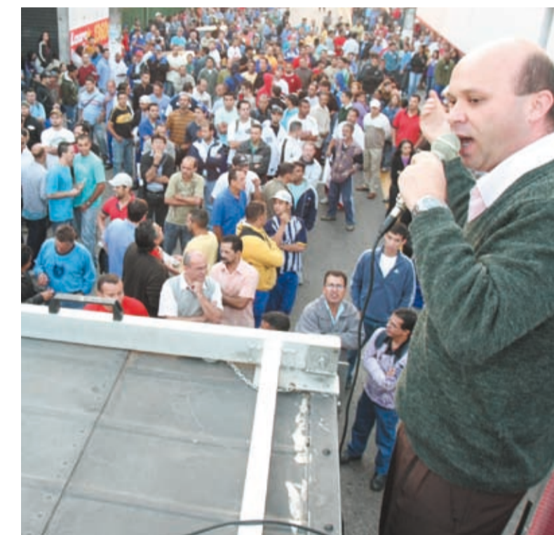
Em Diadema, companheiros nas autopeças reafirmaram disposição de luta

um momento como este no setor automotivo. Agora, mais do que nunca, é a hora de reivindicar avanços para os trabalhadores. E o aviso já foi dado: se os companheiros não aprovarem as propostas, na segunda-feira a greve começa e a fábrica vai ficar completamente parada”, completou.