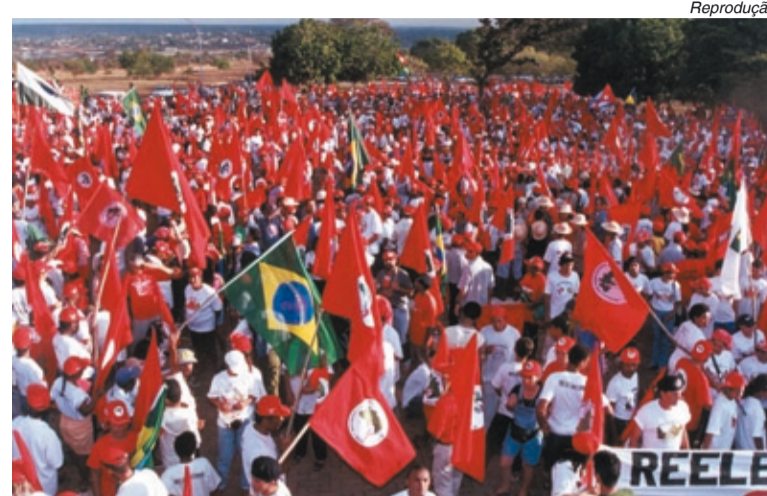
Promotores gaúchos querem o fim do Movimento dos Sem-Terra

Outra denúncia é o relatório aprovado pelo Conselho Superior do Ministério Público gaúcho, que pede a dissolução do MST e proíbe os órgãos públicos de negociarem contratos e convênios com os sem-terra.