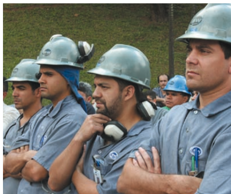
Categoria volta ao mesmo patamar de 1991

Este é o maior crescimento dos últimos cinco anos. Com mais essa marca, os metalúrgicos voltam a patamares alcançados pela última vez em 1991.