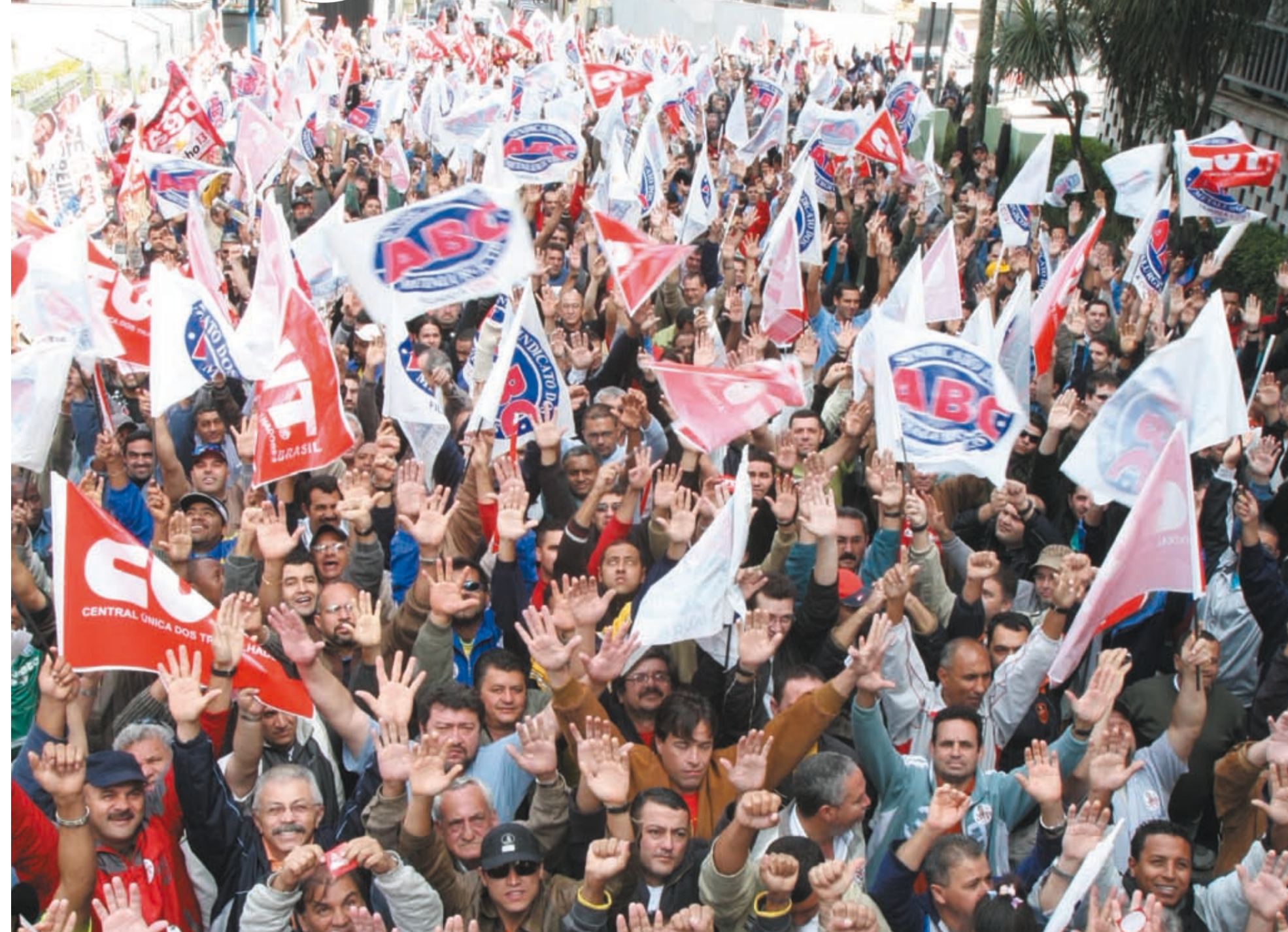
Assembléia de ontem lotou a rua do Sindicato e mostrou disposição de lutar por um bom acordo

Aviso de greve será enviado hoje às montadoras, que ofereceram somente 0,5% de real, e ao Grupo 3, que nem proposta fez. Categoria inicia ações de pressão. Nos grupos 2 e 8 as negociações continuam.