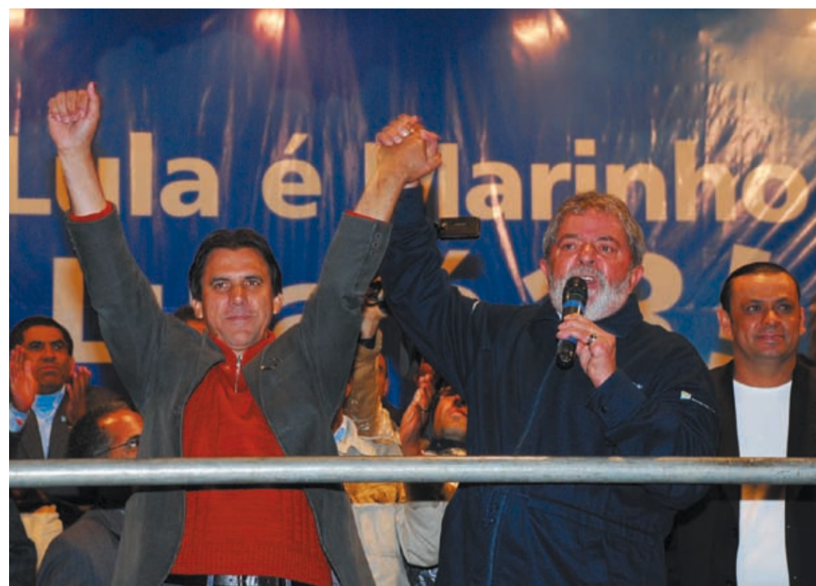
Quando acabar seu mandato, Lula voltará para São Bernardo e quer a cidade governada por Marinho

Lula defendeu a candidatura de Marinho e afirmou que pretende voltar para a cidade com o petista na administração. “No dia 2 de janeiro de 2011, quando eu voltar para a cidade, porque não vou para Roma nem para a Londres, quero ver aqui