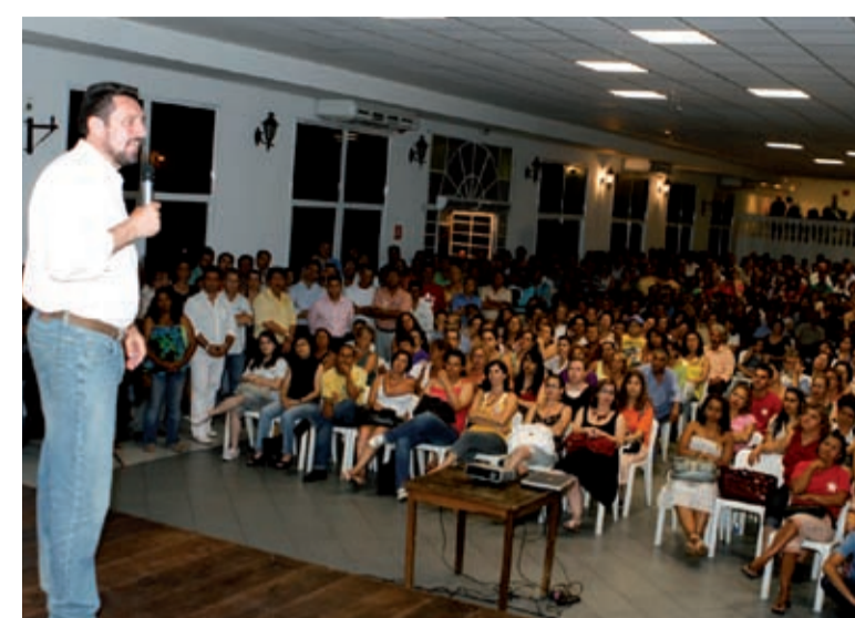
Siraque ganhou apoio do PTdoB e agora são 13 partidos a seu lado

“Nossos adversários disseram que fariam uma frente anti-PT, mas nada disso aconteceu. Temos agora de trabalhar a favor