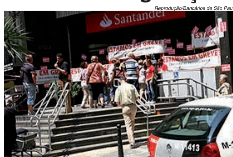
Durante o dia, greve; à noite, categoria fez assembleia

Mesmo com a retomada das negociações com os banqueiros, os bancários mantiveram-se em greve, ontem, e completaram nove dias da paralisação.