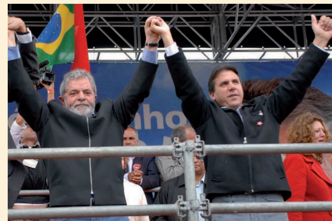
Lula estará domingo em São Bernardo para apoiar Marinho

Enquanto isso, os candidatos acertam as últimas alianças e estratégias para o dia 26. Leia mais na página 3