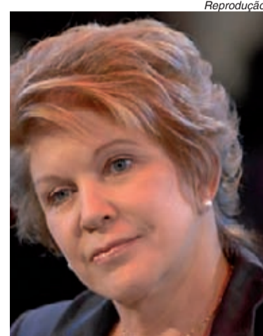
Marta vai para o 2º turno em SP

O PMDB é o partido que mais elegeu prefeitos. Foram 1.124 contra 1.054 em 2004. Já o PT elegeu 546, contra 413 em 2004.