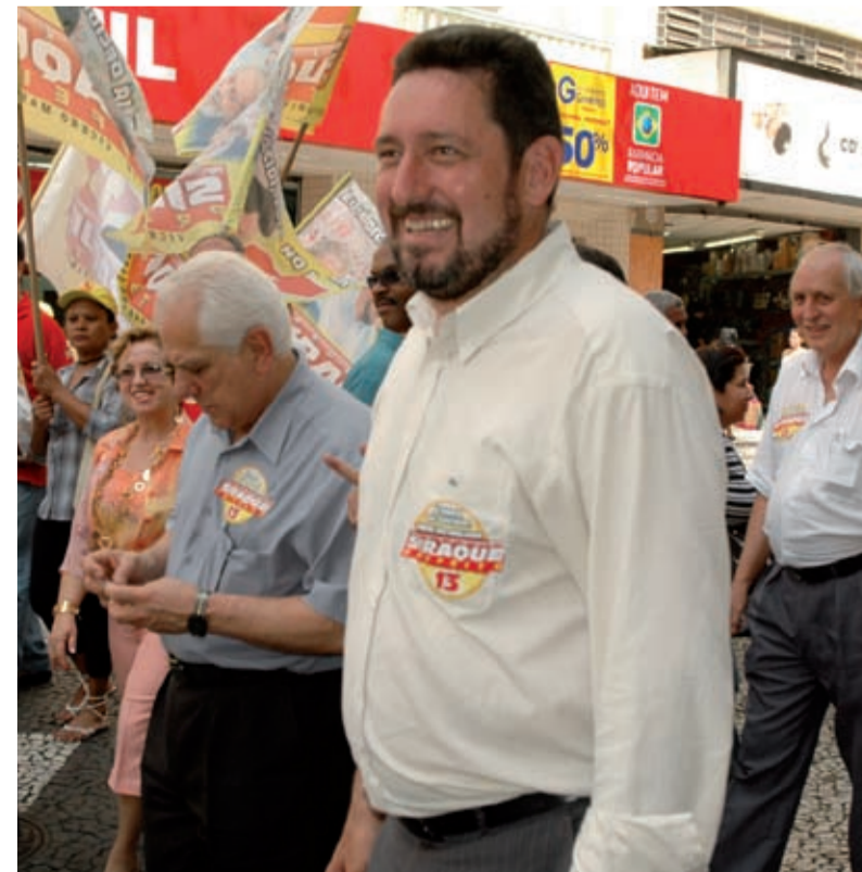
Siraque conquistou mais que o dobro de votos do segundo colocado