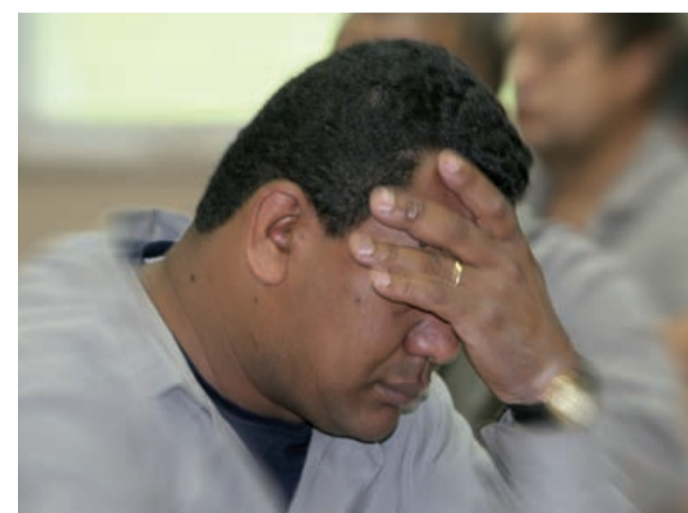
Depressão e demais transtornos mentais aumentaram quase dez vezes

A análise foi feita ao comentar o levantamento realizado pela Previdência Social entre 2006 e 2008,