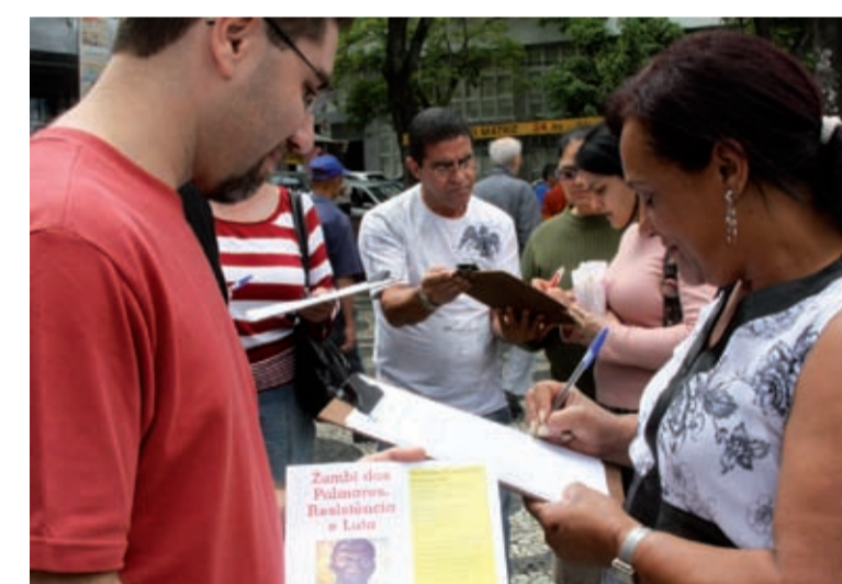
Entidades do movimento negro e sindicatos passaram abaixo-assinado ontem, em defesa do feriado de 20 de novembro em São Bernardo

“À medida que o debate da identificação racial ganhou as páginas dos jornais; que negros são apresentados nas telas como personagens e não apenas empregados domésticos; são vistos como o Supremo Tribunal Federal e ocupando os mais diversos cargos na política; que o movimento negro sai da marginalidade e ocupa espaços no debate político, a identidade negra sai fortalecida”, afirma a publicação.