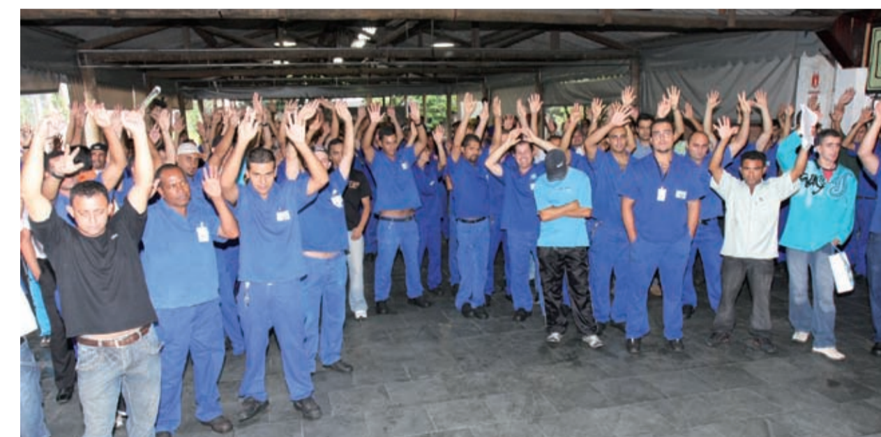
Trabalhadores aprovam acordo em assembleia realizada ontem