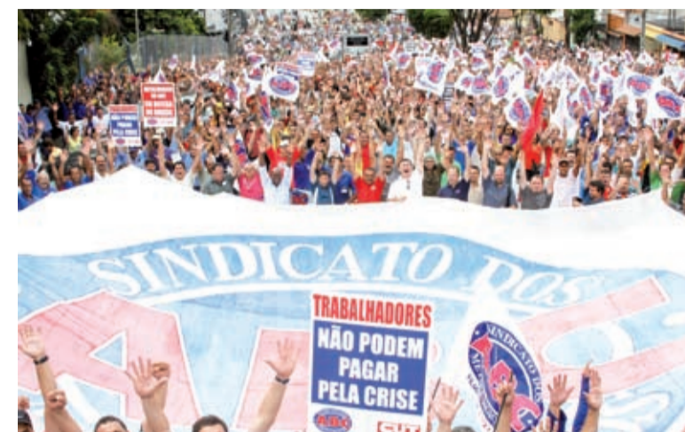
Nas ruas em janeiro, metalúrgicos declaram guerra às demissões

“Entre vários outros, trabalhadores na Mercedes, Mahle, Ford e Rassiní