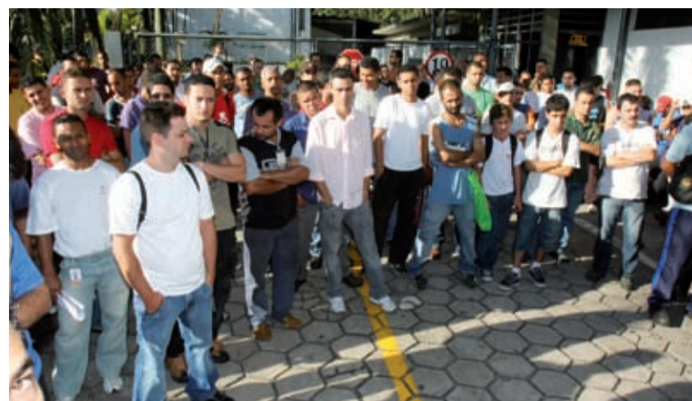
Novos protestos podem acontecer nesta semana