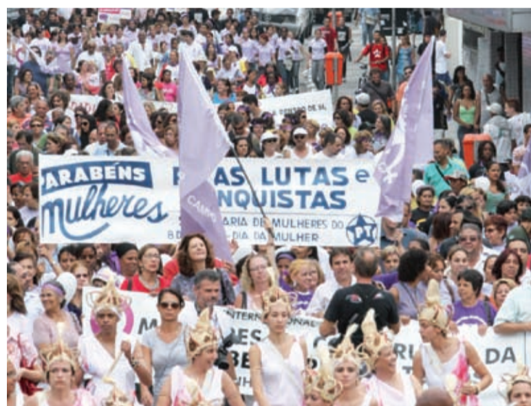
Caminhada reuniu cerca de duas mil pessoas

A Assessoria, segundo o prefeito, tem como meta desenvolver projetos que ampliem a participação efetiva das mulheres, garantam seus direitos e a diminuição da desigualdade.