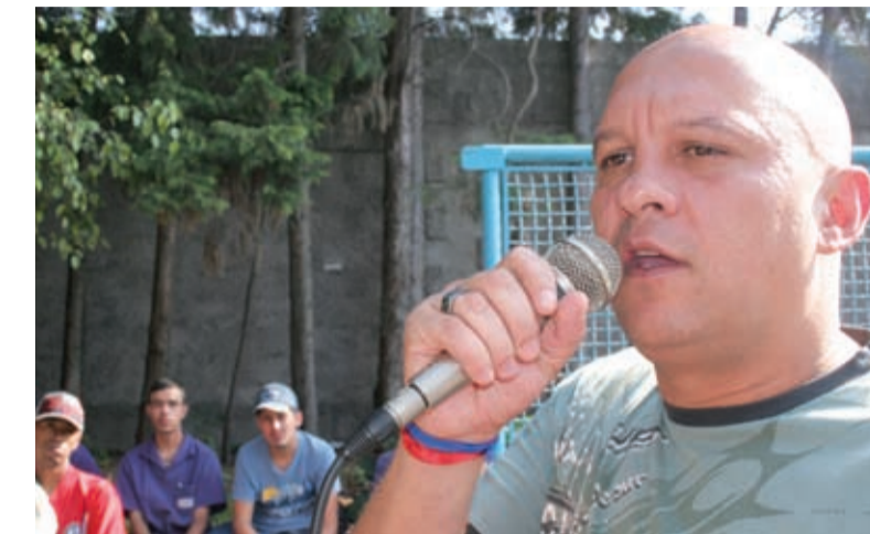
Moisés disse que o cenário indica um quadro melhor

Este é a terceira autopeças em nossa base que