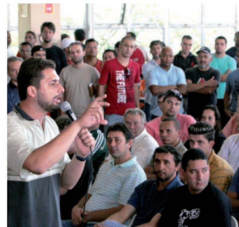
Trabalhadores na Mercedes em plenária do 6º Congresso, sábado

O outro foco é Sindicato e Sociedade, no qual será destacado o papel que o Sindicato desempenha na articulação dos atores sociais (poder público, movimentos sociais, empresários) do ABC para a criação de ações de desenvolvimento regional e de combate ao desemprego.