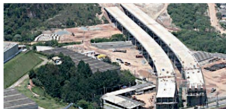
Segundo relatório, rombo seria de R$ 184 milhões

Essa obra custou 75% a mais que o previsto mas, legalmente, os contratos públicos só podem receber aditamentos de até 25% do valor original.