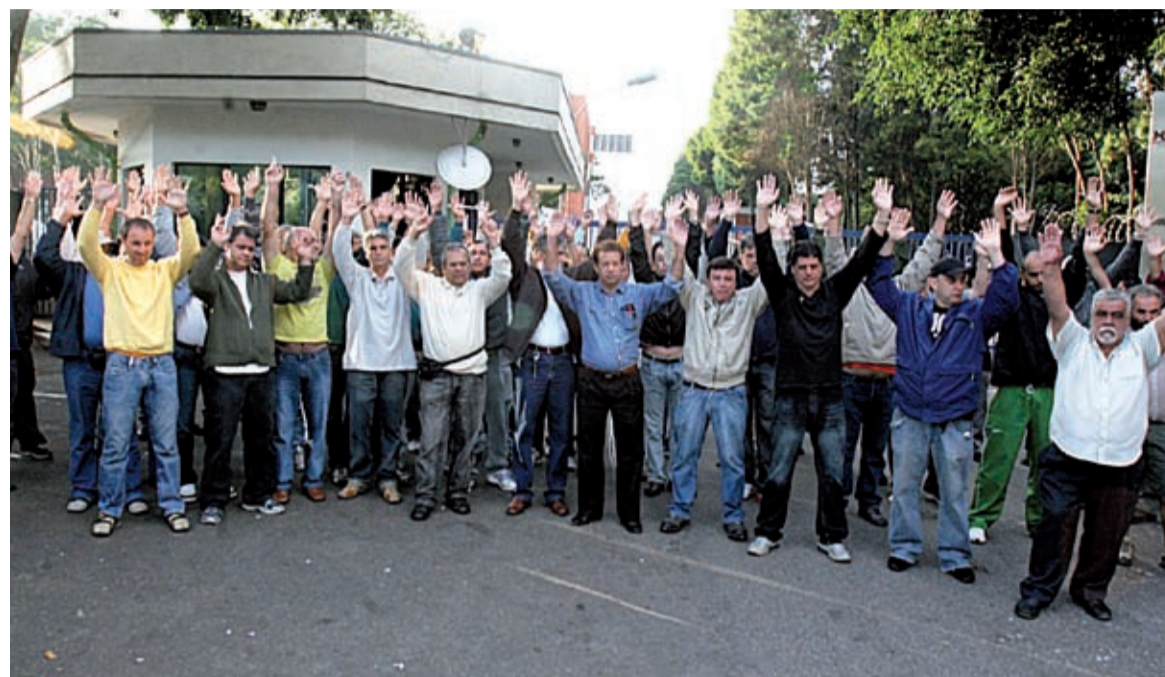
Trabalhadores decidiram usar todos os meios para evitar o calote

Veira, diretor do Sindicato, a Thyssen vendeu para a Cross Hueller a produção de máquinas em 2005. Desde então, os trabalhadores cumpriam as mesmas funções, nas mesmas máqui-