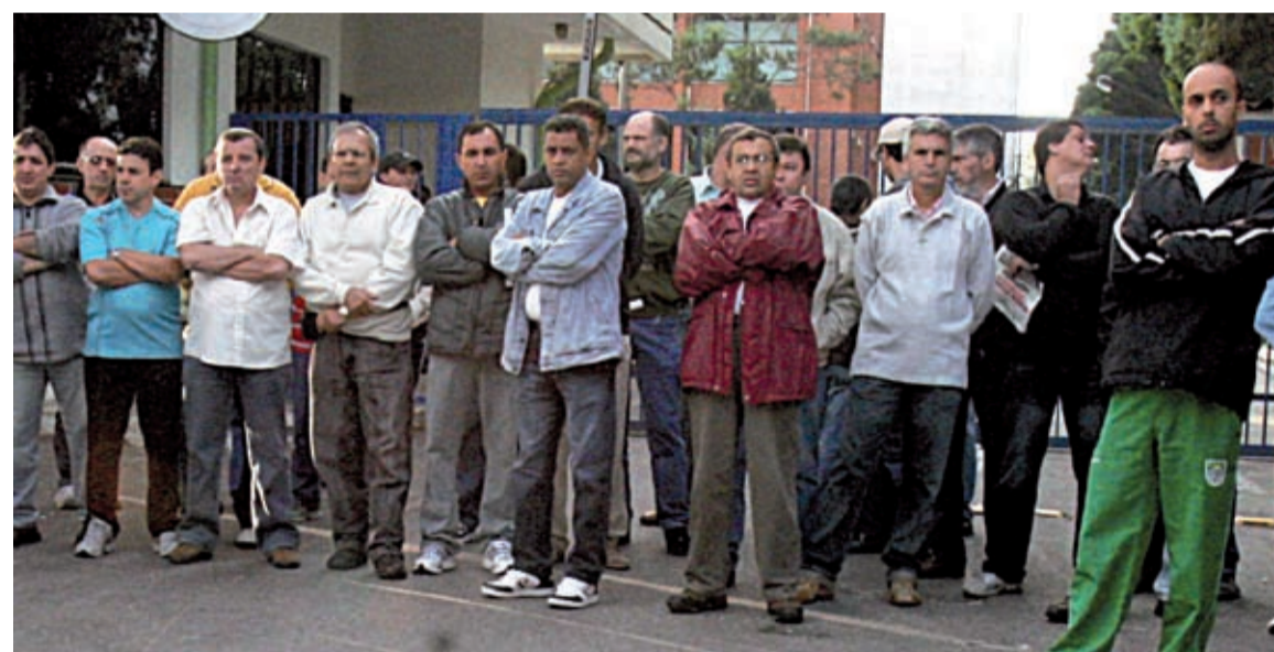
Manifestação do pessoal na Cross Hueller na última quinta-feira Fábrica de máquinas em Diadema encerra produção e deixa 128 companheiros na mão.