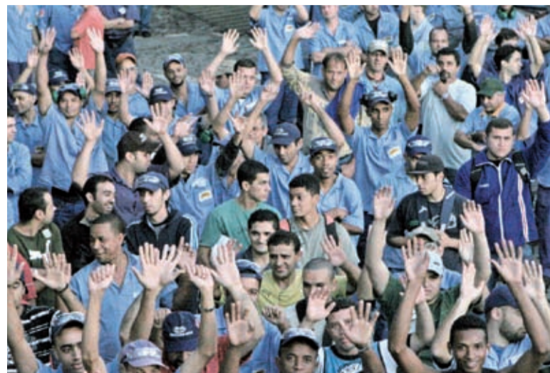
Na Rassini, mobilização garantiu um bom acordo