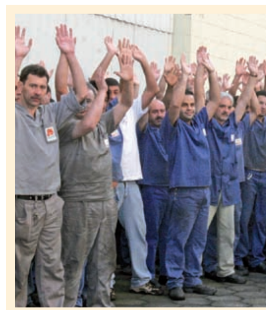
Votação na Backer, ontem