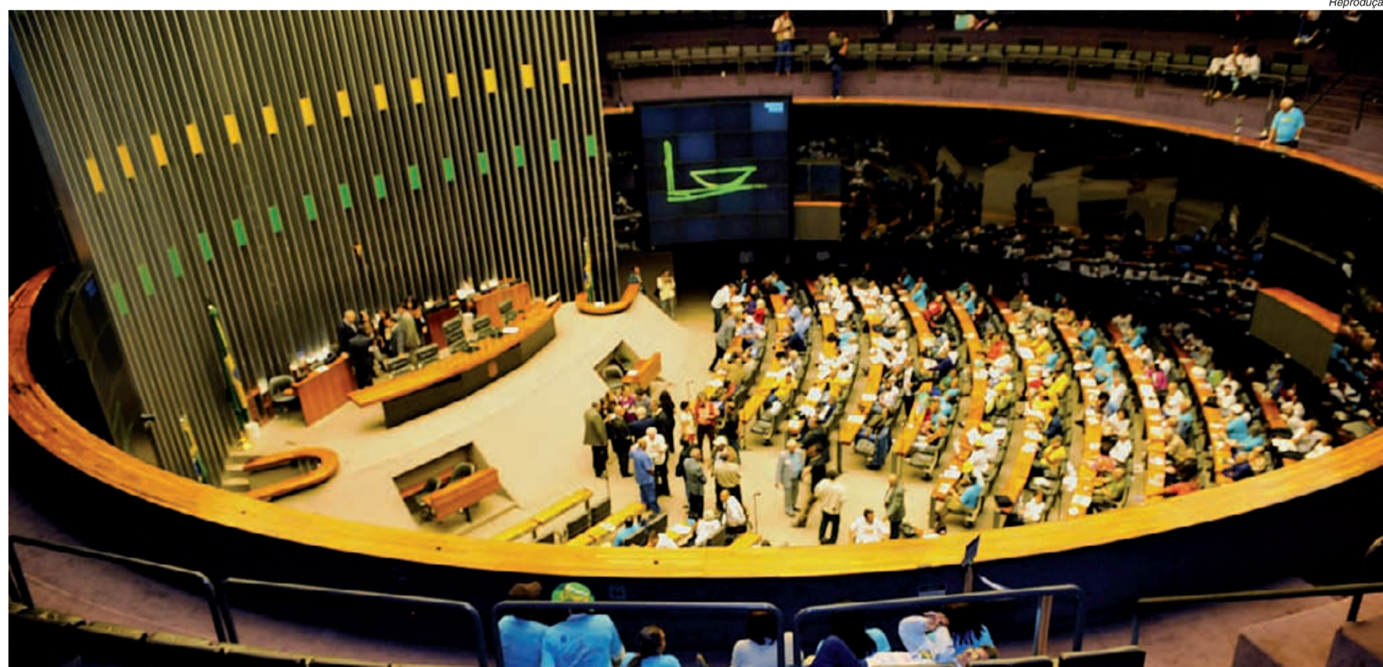
Centrais negociam com congressistas a votação de matérias de interesse dos trabalhadores

Redução da jornada e fim do fator previdenciário são duas das matérias de interesse dos trabalhadores que esperam na fila pela votação dos deputados e senadores.