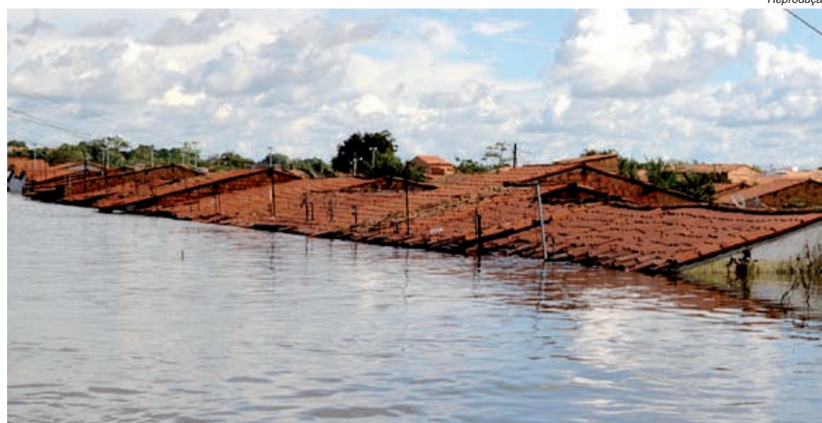
Águas do rio Mearim cobriram casas em Trizidela do Vale no Maranhão

Apesar do número quatro vezes maior de pessoas que precisam urgentemente de ajuda, só três helicópteros e três aviões atuavam na região na semana passada e as doações não alcançaram