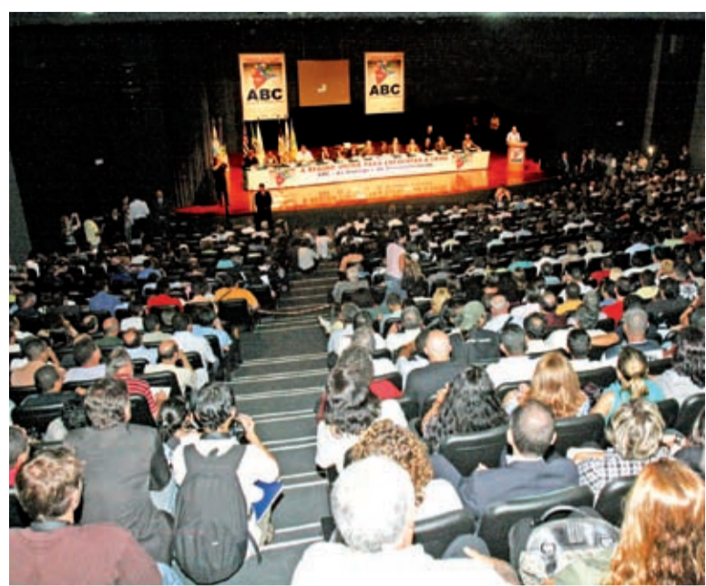
O grupo de trabalho é resultado do seminário realizado em março

O GT é resultado do seminário ABC do Diálogo e do Desenvolvimento, realizado no início de março para diagnosticar os efeitos da crise econômica mundial na região