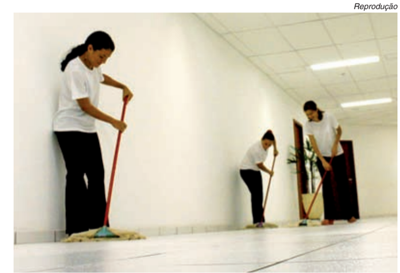
Projeto no Congresso vai regulamentar serviços de terceiros