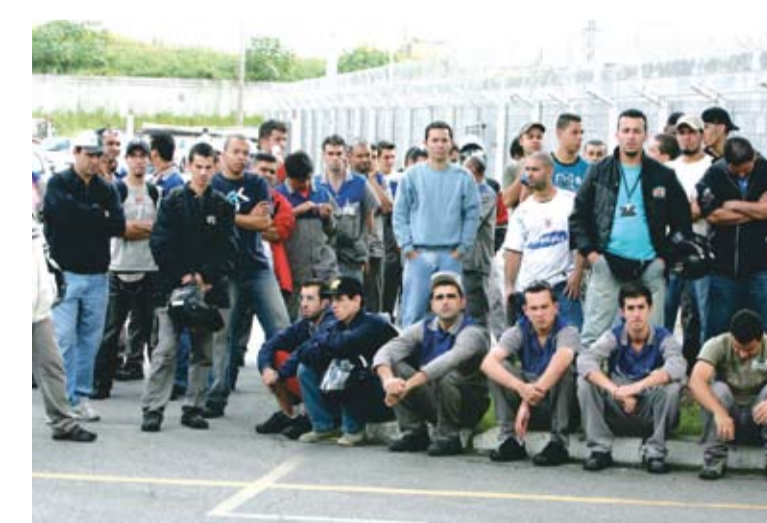
Companheiros querem duas folgas alternadas

“As negociações não avançaram e a ThyssenKrupp reapresentou a mesma proposta de um sábado ao