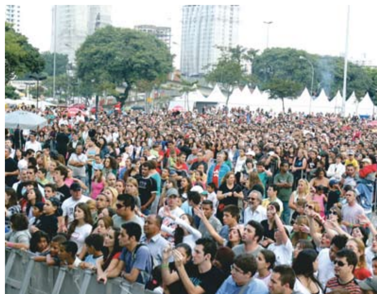
Ato do 1º de Maio abriu as comemorações dos 50 anos do Sindicato

No dia 12, terça-feira, data em que completa 50