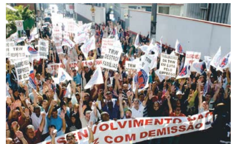
Mobilização garantiu readmissão dos dispensados

Na época, o Sindicato não reconheceu as dispensas e deu início à mobili-