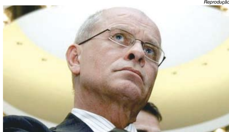
Berthold Huber, presidente do IG Metall

Na mensagem, assinada pelo presidente Berthold Huber, o IG Metall lembra os atuais problemas que afetam os trabalhadores, especialmente em relação à manutenção do emprego, os laços que unem as duas entidades e a importância dos metalúrgicos do ABC para o movimento sindical brasileiro.