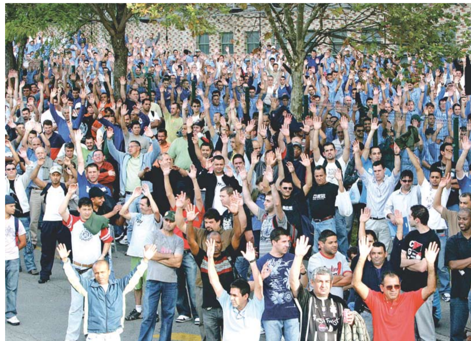
Pessoal na Volks fez assembleia ontem na troca de turnos

Pagamento vem ainda em maio e será reajustado em mais de 15% sobre o valor do ano passado. Também sai acordo na General Dynamics, de Ribeirão Pires.