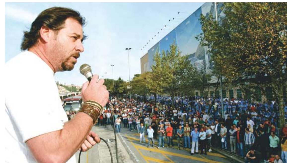
Frangão disse que a Volks pode superar a produção recorde do ano passado

Durante a assembleia, o coordenador da Comis-