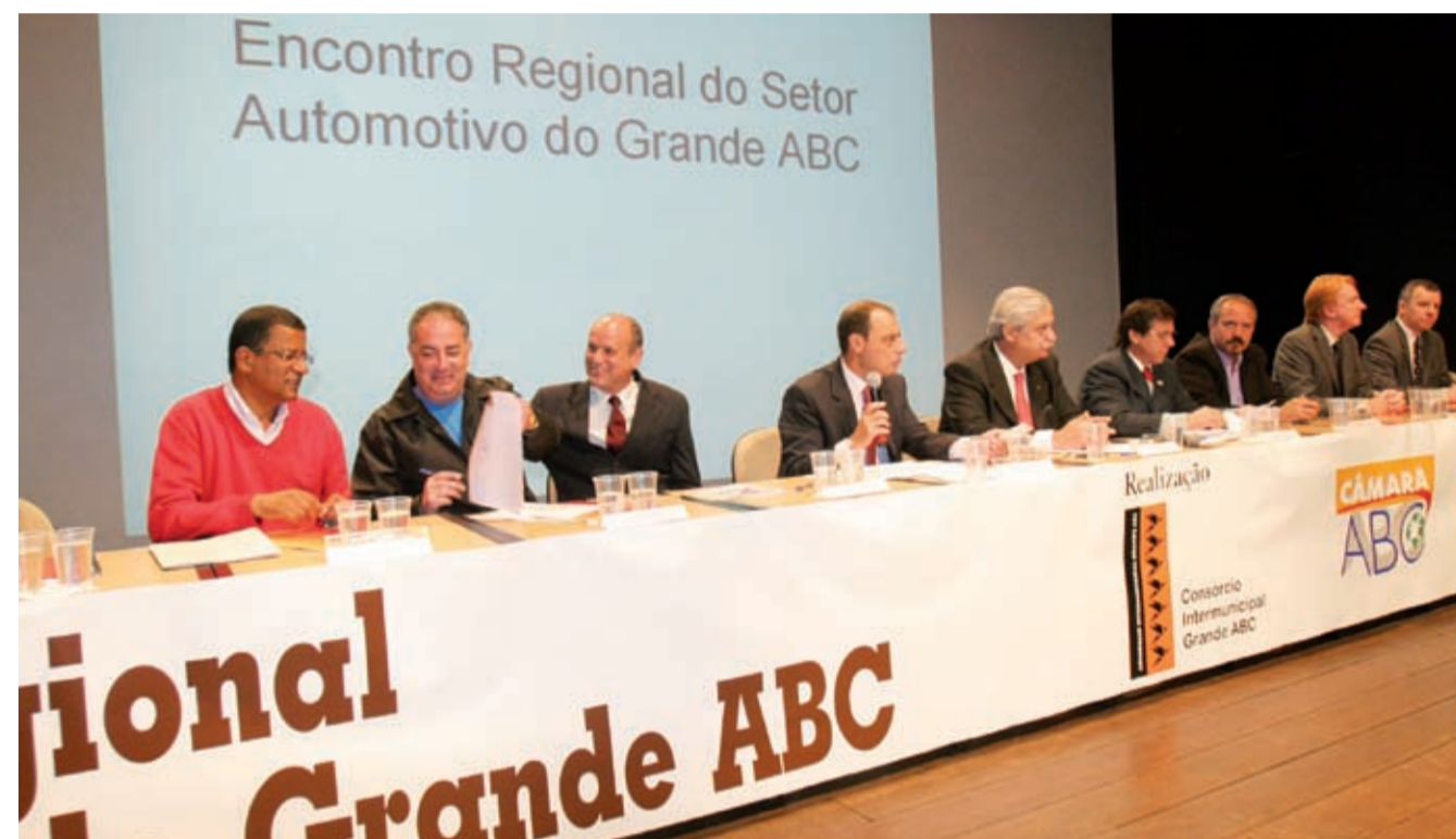
Representantes de trabalhadores, do poder público e das empresas instalam o GT do Setor Automotivo do ABC

Grupo de trabalho (GT) que vai analisar a situação do setor de automóveis no ABC foi instalado na última sexta-feira.