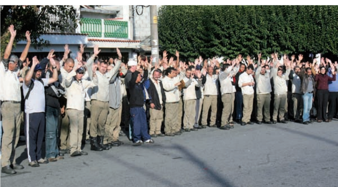
Assembleia dos companheiros na Mangels. Valor da PLR tem novo cálculo. Em assembleias realizadas ontem, os trabalhadores apoiaram propostas apresentadas pelo Sindicato.