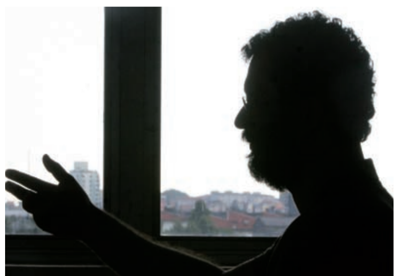
Autor do depoimento prefere não ser identificado para evitar represálias das empresas

das essas manifestações de maus tratos com o corpo se apresenta de maneira agressiva. A depressão, a angústia e aquela sensação de insanidade começam a nos rondar cada vez mais perto.