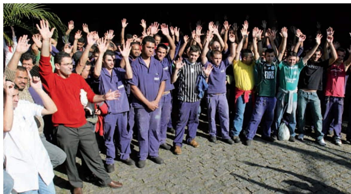
Valor da PLR dos trabalhadores na Sambercamp é proporcional à produção

Pra não esquecer Um acidente aéreo choca. Mas devemos lembrar que o trânsito brasileiro faz 35 mil vítimas fatais por ano.