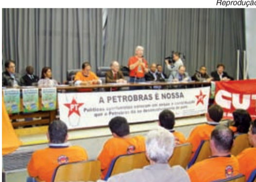
Ato pediu volta do monopólio do petróleo

“Os que hoje investem na CPI são os mesmos que no governo Fernando Henrique, em 1997, aprovaram uma lei criminosa contra o monopólio estatal e a Petrobras. O que está por trás