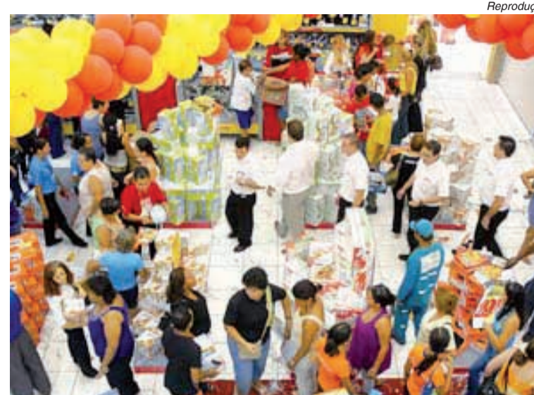
Consumo interno manteve a economia aquecida