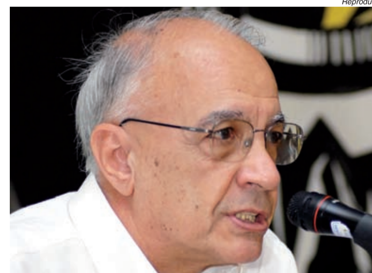
Para Sader, construção do novo mundo está na América Latina

Estes foram os principais motivos, segundo o cientista político Emir Sader, que levaram as forças de esquerda à derrota na Europa e permitiram o avanço de setores da direita e mesmo da extrema direita nas eleições do último final de semana.