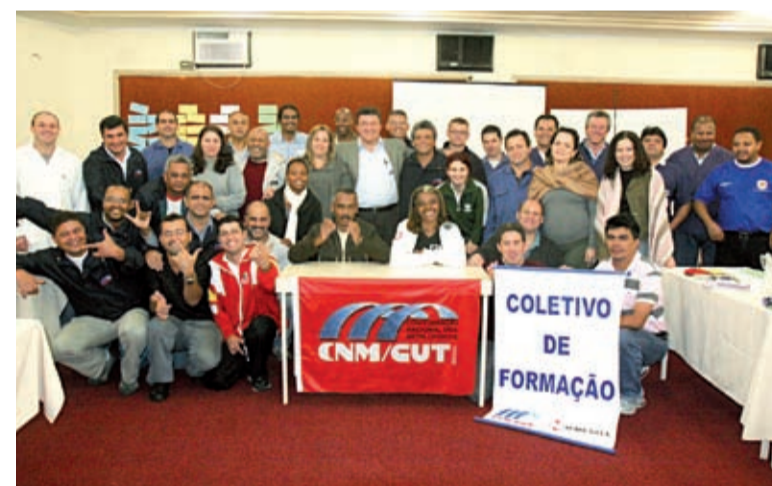
Agora, formadores irão atuar em seus sindicatos

A Confederação Nacional dos Metalúrgicos (CNM) da CUT concluiu, na semana passada, em São Bernardo, seu curso de Formação de Formadores. Passaram pelas aulas 20 dirigentes de todo o País, que agora vão implantar ou incrementar cursos de formação em suas bases.