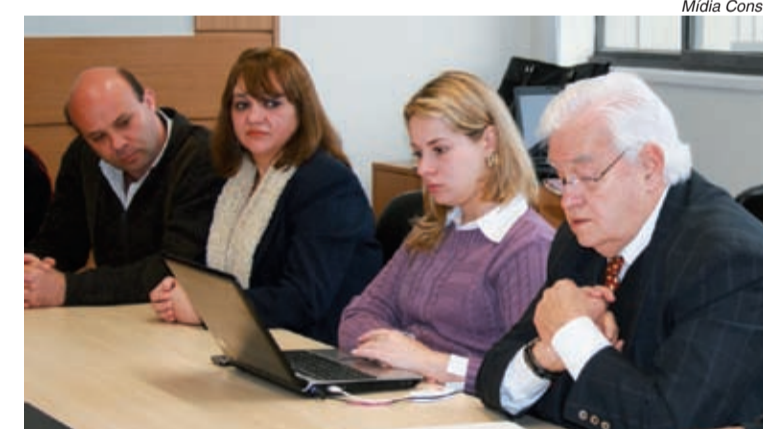
Bancadas da FEM e do Grupo 3 decidiram ontem negociar cláusulas sociais antes das econômicas

O Grupo 8 e a FEM-CUT definiram ontem o calendário de negociações para os dias 11, 13 e 25 de agosto. Cerca de 220 mil metalúrgicos de todo o Estado de São Paulo participam da campanha salarial deste ano.