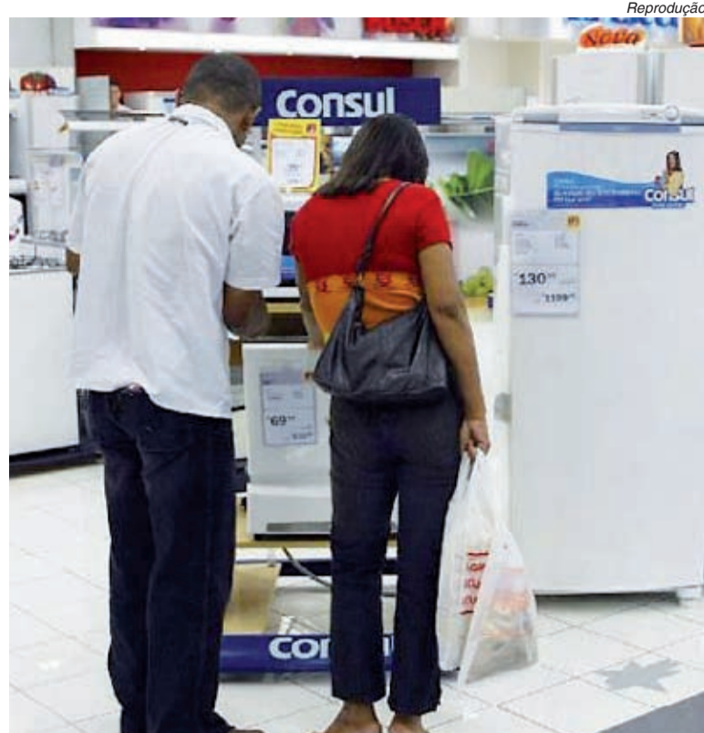
Contratações no comércio reduziram o desemprego

A pesquisa mostrou também que o rendimento médio caiu 1,2%, passando de R$ 1.276,00 em abril para R$ 1.199,00 em maio.