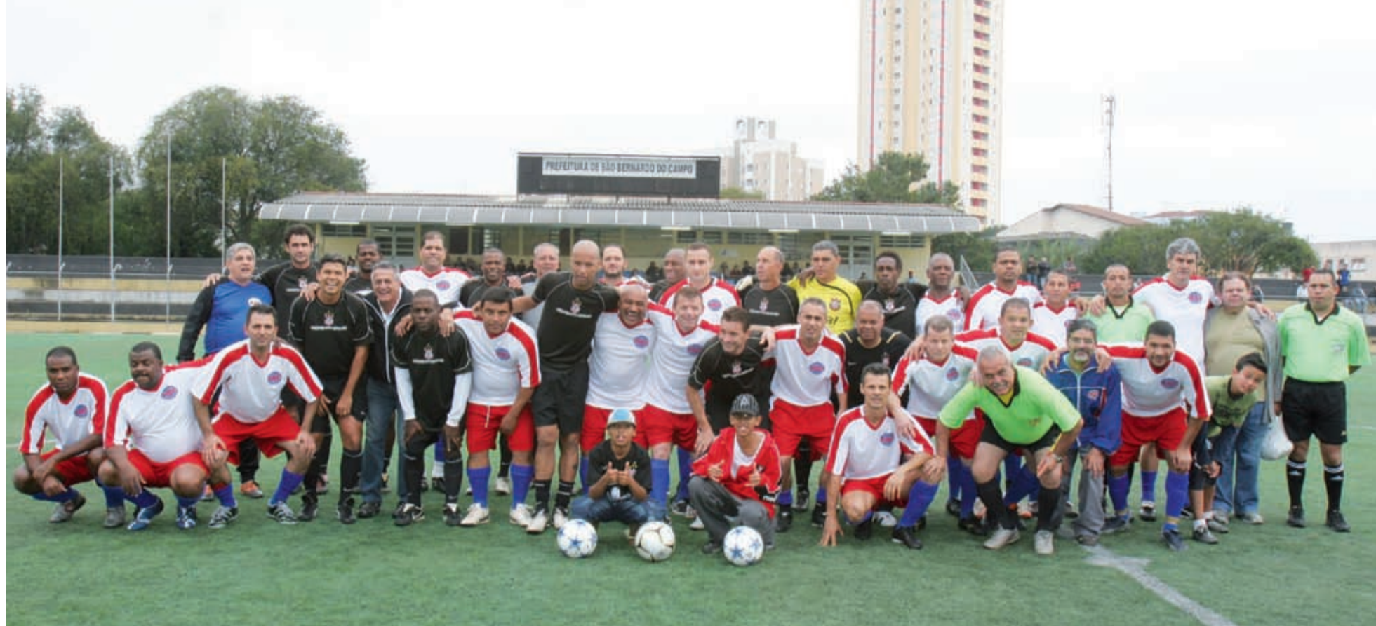
As equipes do Sindicato e do Corinthians se confraternizam antes da partida realizada sábado no estádio Baetão, em São Bernardo

Jogo de veteranos arrecada uma tonelada de alimentos. Dez mil litros de leite foram doados por trabalhadores na Volks. Conheça estas e outras ações da categoria em favor das vítimas das chuvas no Norte e Nordeste do País.