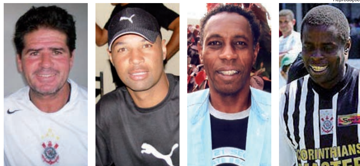
João Paulo II

Os alimentos arrecadados serão encaminhados às vítimas das enchentes no Nordeste. “É uma forma diferente de prestarmos solidariedade a quem está