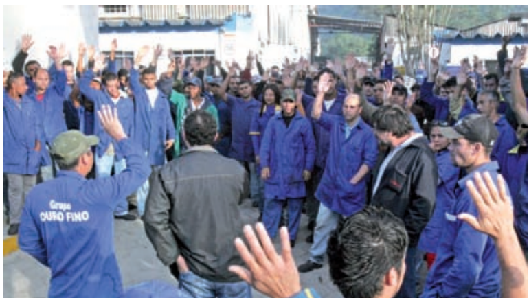
PLR na Ouro Fino também será paga aos afastados

Outra empresa a fechar acordo foi a Spraying Systems , em São Bernardo. A pri-