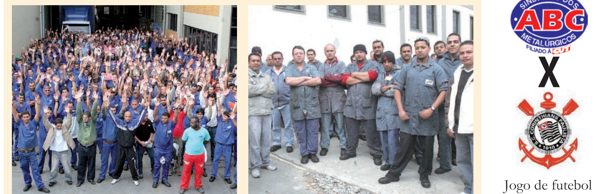
Trabalhadores na Delga cruzaram os braços para conseguir um bom acordo Valores baixos e metas impossíveis provocaram a rejeição na Faparmas

Protestos, braços cruzados, aprovações, rejeições. Metalúrgicos do ABC mobilizados em busca de bons acordos.