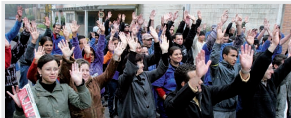
Na Ugimag, trabalhadores conquistaram valor superior ao do ano passado