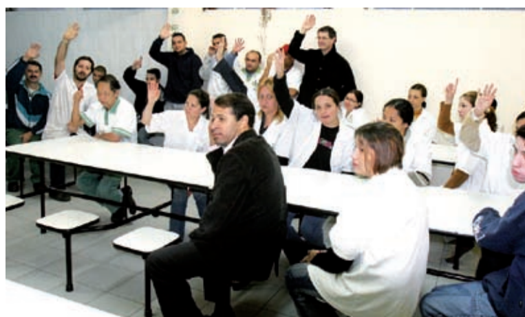
Na MTE Thomson o pagamento sai na segunda-feira