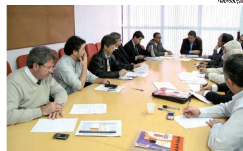
Os dois primeiros temas do grupo são crédito e logística