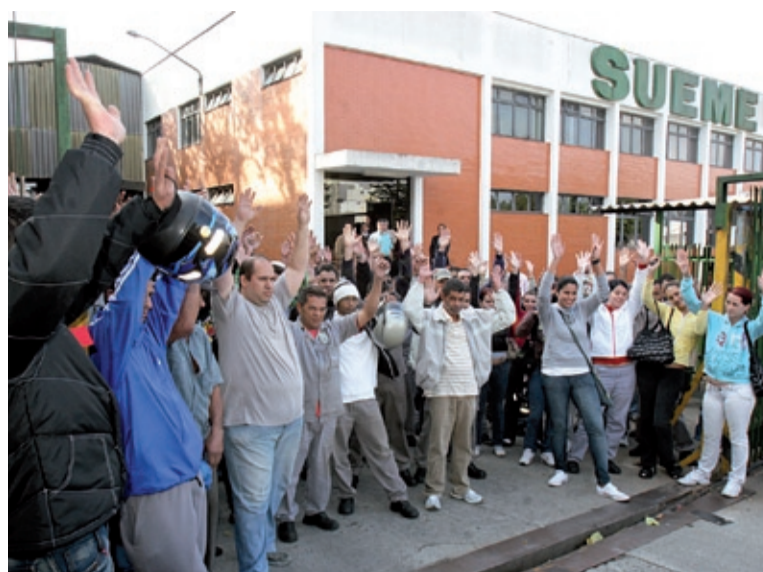
Trabalhadores na Sueme querem outra forma de pagamento

O Tribunal reformulou a proposta da empresa e chegou a um valor que agradou os companheiros. Assim, em reunião no Sindicato, eles decidiram em encerrar o movimento.