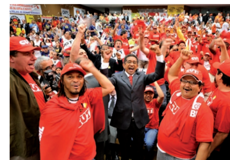
Festa na aprovação da PEC na comissão da Câmara

Exemplo desse ataque ocorreu ontem, quando a Confederação Nacional da Indústria repetiu o mesmo discurso adotado há décadas pelos patrões ao tratar sobre direito dos trabalhadores. Para a CNI, as 40 horas elevarão os custos da produção e serão mais um obstáculo às contratações.