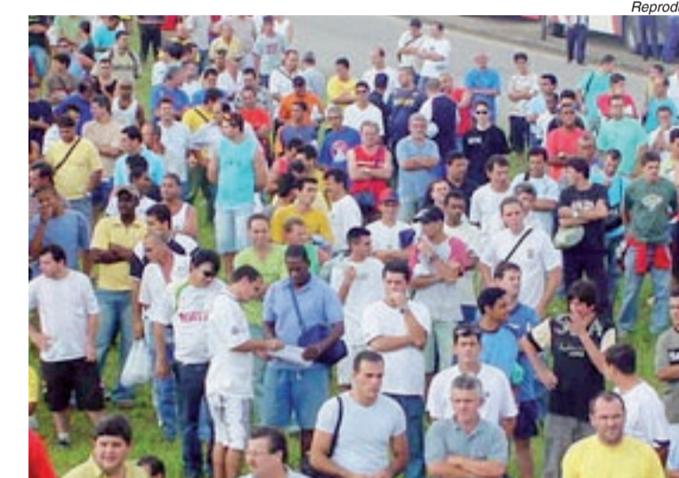
Metalúrgicos de Taubaté também participam da campanha

A FEM-CUT também marcou as primeiras negociações com a Fundação e o Grupo 2 (máquinas e eletroeletrônicos). Fundação será segunda-feira, e, no dia seguinte, o Grupo 2. Também na terça haverá reunião com o Grupo 3 (autopeças, parafusos e forjarias).