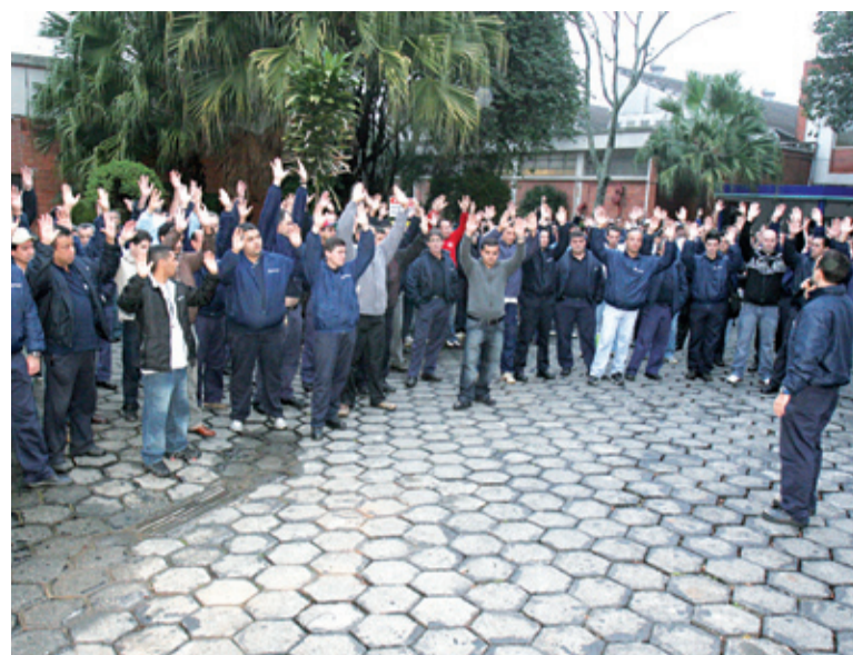
Nova política de cargos tem critérios transparentes