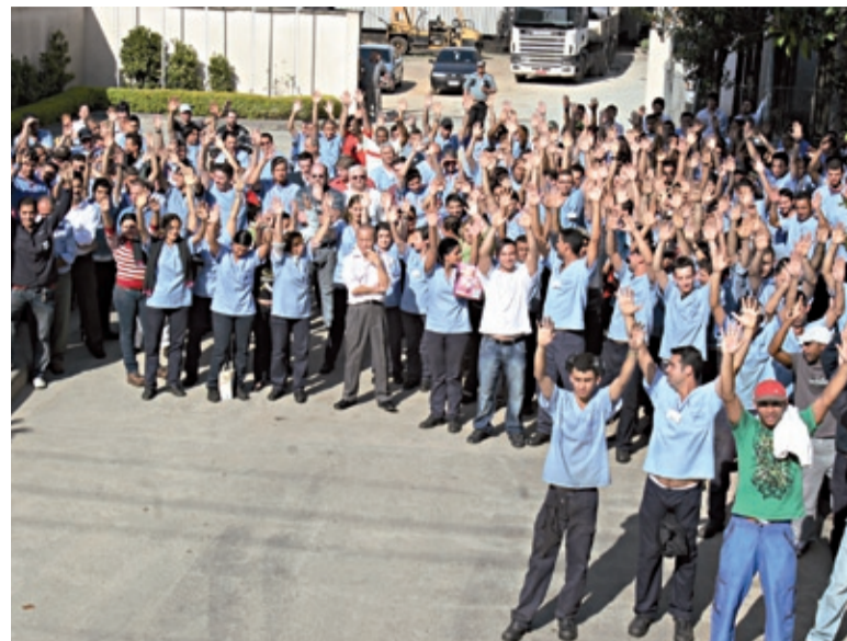
Trabalhadores não querem parcela fixa

presa apresnte uma proposta melhor o mais rápido possível. Caso isso não aconteça, os trabalhadores já demonstraram disposição de luta para ir em busca de um bom resultado”, disse.