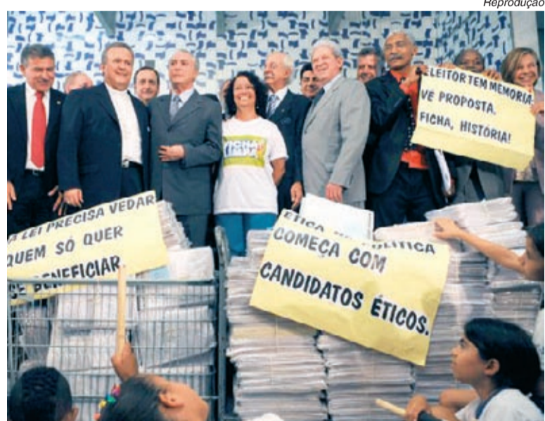
Projeto popular conta com 1,3 milhão de assinaturas

Como a regra eleitoral não muda e não há princípio de anterioridade, para valer