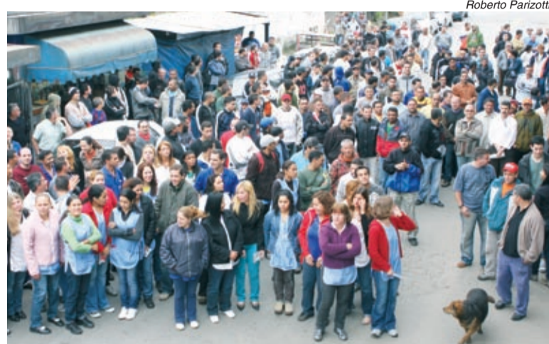
Mobilização do pessoal na Conexel no último dia 17

Depois de parar na segunda-feira, os companheiros na Injecta, fundição de