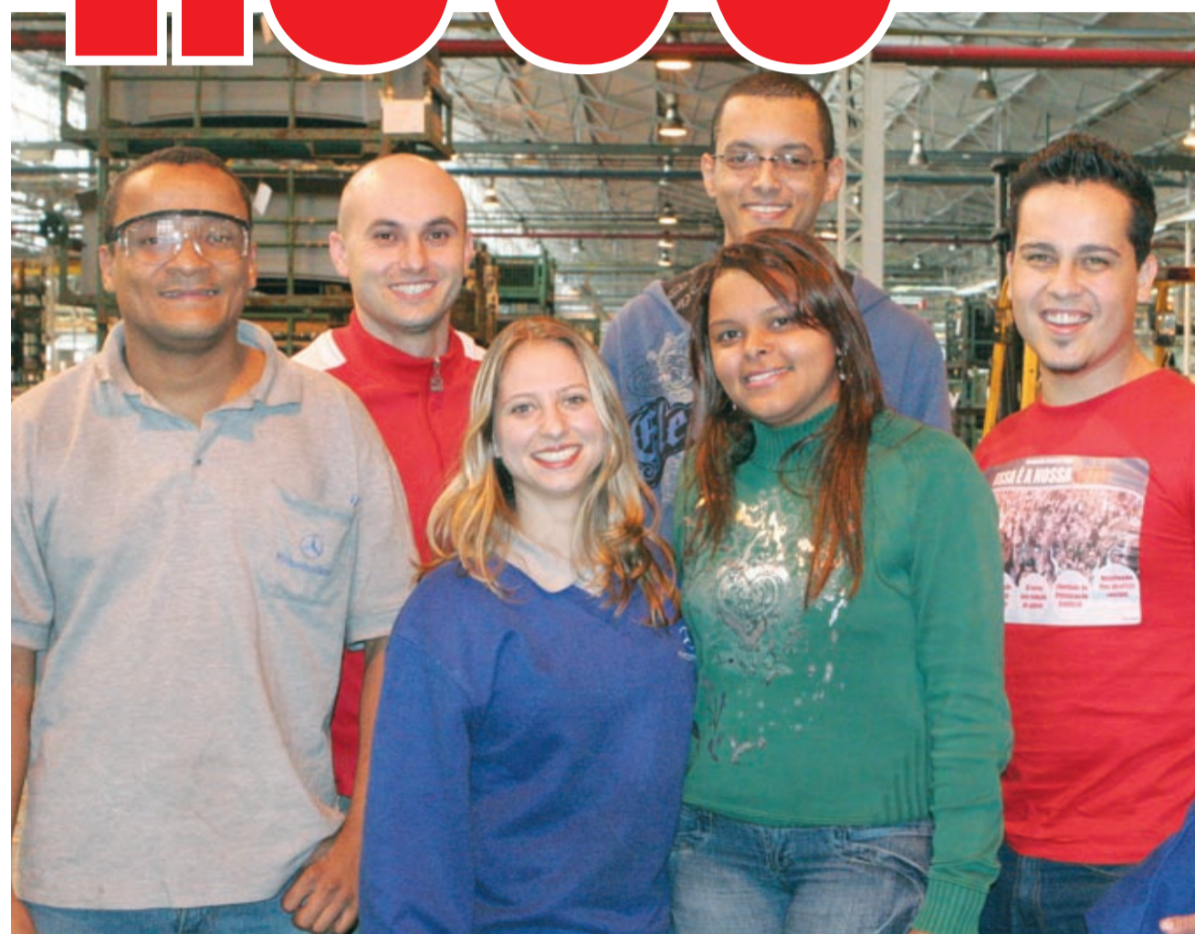
Os trabalhadores terão agora contrato de trabalho definitivo

Ação do Sindicato e medidas do governo federal para enfrentar a crise fizeram crescer a produção de caminhões e permitiram contratações.