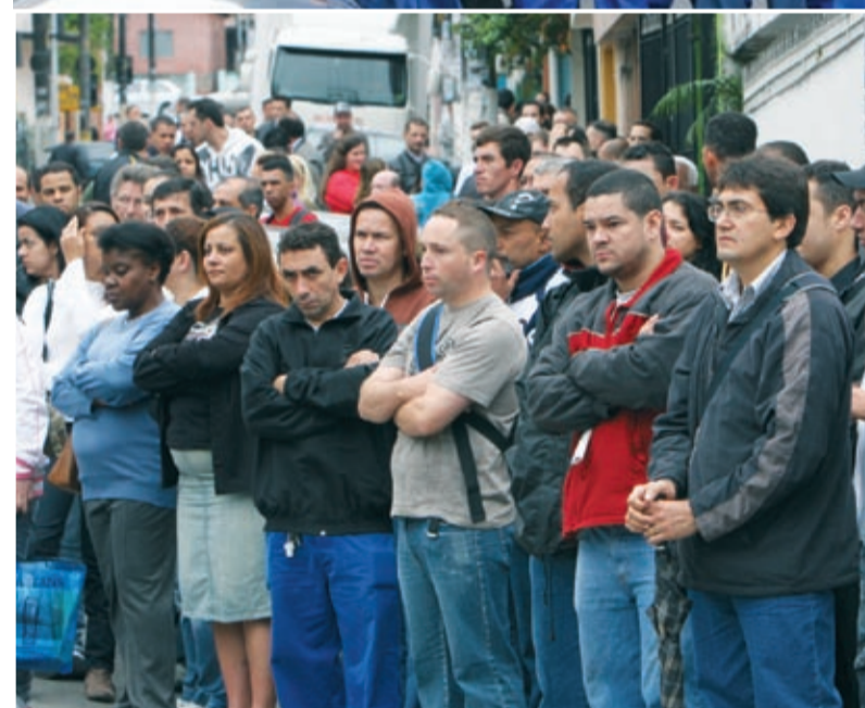
Depois da assembleia, companheiros na Autometal e TRW (acima) foram para casa. Metalúrgicos na IGP (ao alto) pararam das 6h às 9h