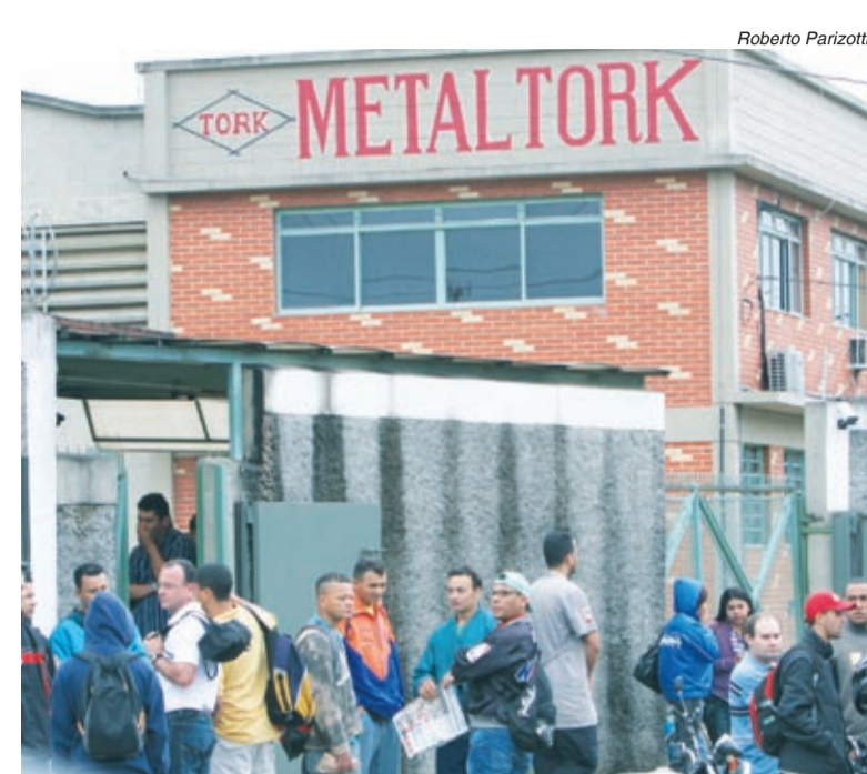
Trabalhadores na Metalork foram para a casa após a assembleia

A assembleia dos metalúrgicos na cidade foi domingo e teve o mesmo encaminhamento que o ABC, de aceitar a proposta das montadoras, de 6,53% de reajuste, mais abono de R$ 1.500,00 e intensificar a mobilização nos demais grupos.