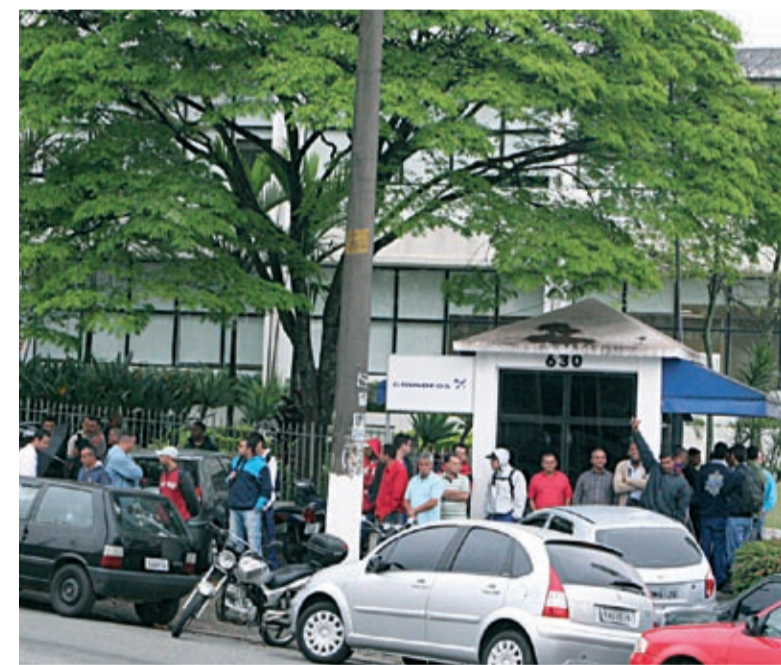
Companheiros na Mark Grundfos cruzaram os braços das 6h às 9h