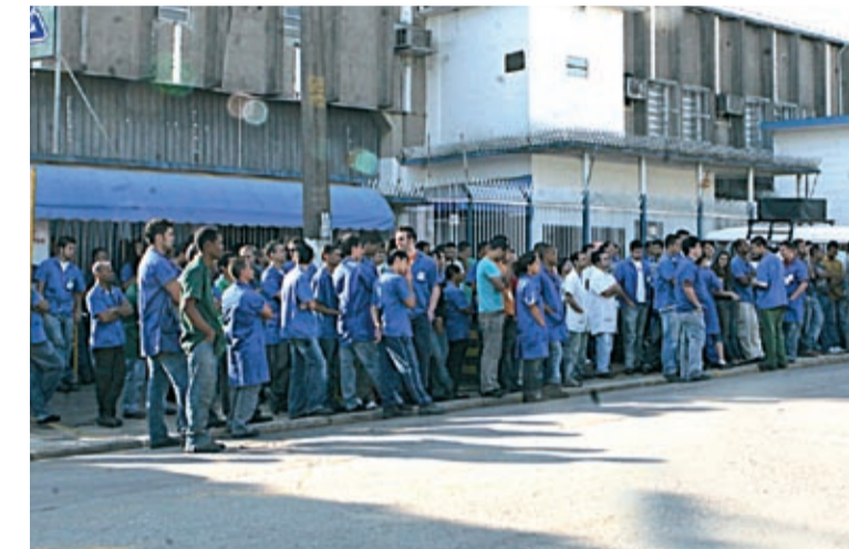
Na SMS, outra assembleia de campanha salarial ontem