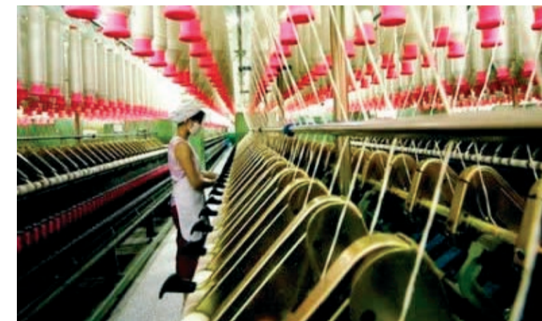
Aumento está apoiado na massa salarial e no emprego

A produção industrial do País apresentou crescimento de 2,2% em julho, na comparação com junho. Este foi o melhor resultado do ano, de acordo com dados divulgados ontem pelo IBGE.