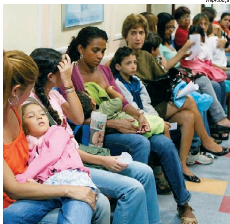
Atendimento no SUS vai demorar mais com a terceirização

Público, a lei fere os princípios de igualdade e universalidade do SUS (Sistema Único de Saúde), pois cria dois tipos de cidadãos.