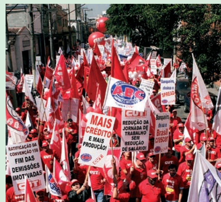
Milhares de trabalhadores saíram às ruas da capital

Com os novos valores, apenas os trabalhadores aposentados colocarão mais de R$ 7 bilhões na economia do País no ano que vem.