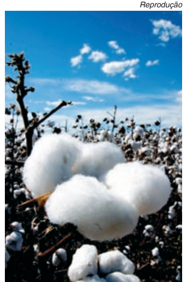
Justiça considerou ilegal subsídio norte-americano ao algodão

“Não é só o Brasil que ganha, mas todo o sistema de comércio multilateral”,