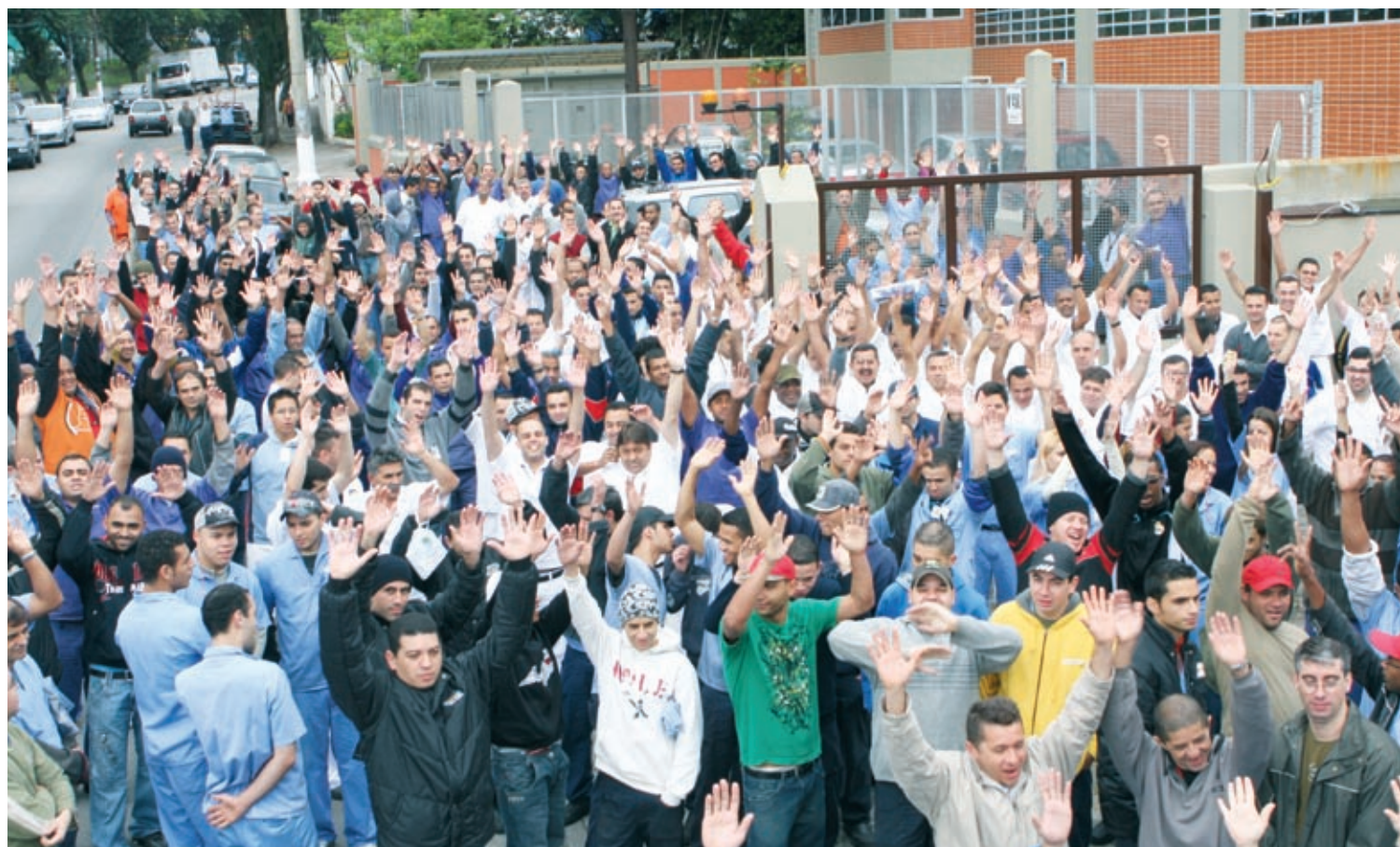
Manifestação conjunta dos companheiros na Proema, Mark Grundfos, Fibam, Filtrágua e Partner