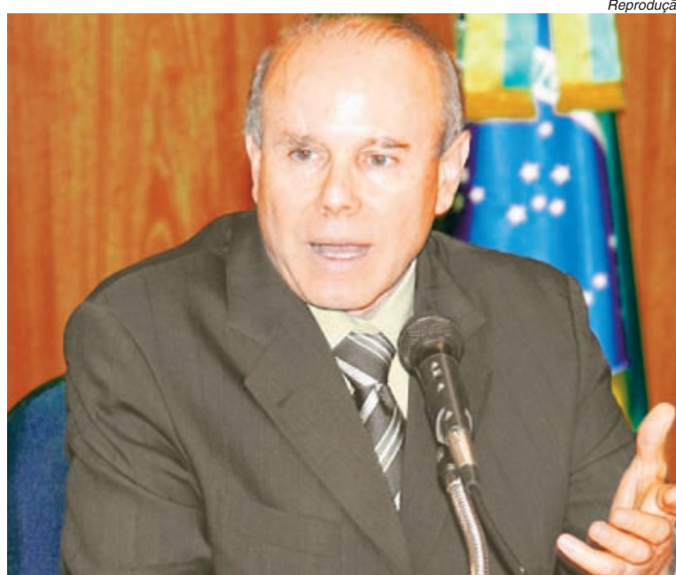
Medidas do ministro foram decisivas para a superação da crise

A entrega será nesta sexta-feira, às 18h, na Sede do Sindicato, e todos estão convidados.