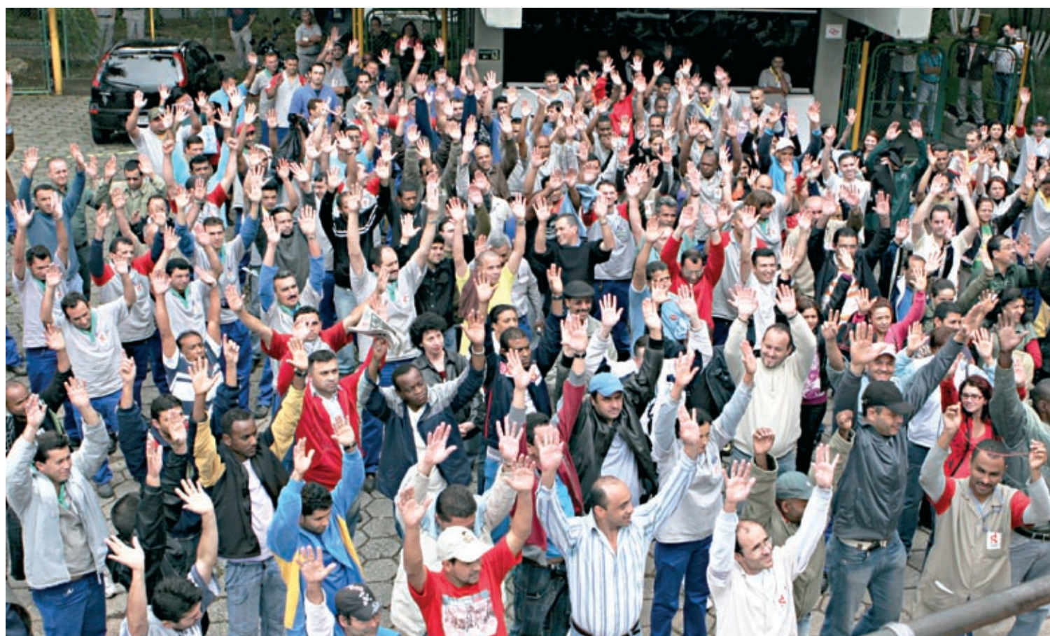
Trabalhadores na Panex estão prontos para a luta

Metalúrgicos do ABC definem amanhã a resposta aos patrões dos Grupos 2, 3, 8 e Fundação, que ainda não apresentarem uma boa proposta de acordo. Dois mil companheiros em 14 empresas na base realizaram paralisações ontem.