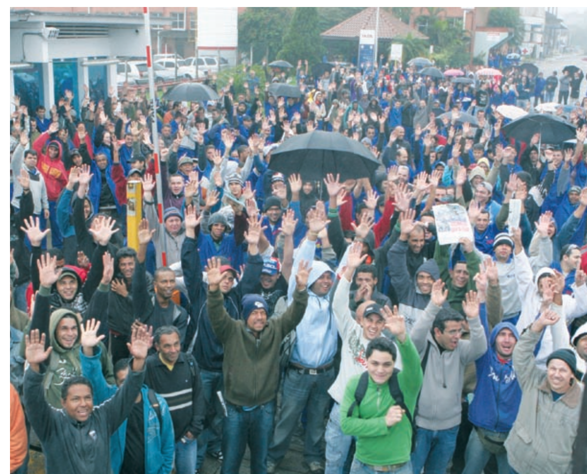
Na Dura, o protesto durou duas horas

Amanhã tem negociação com o Grupo 2 (máquinas e eletroeletrônicos). Grupo 8 e Fundação não tem encontros agendados para esta semana.