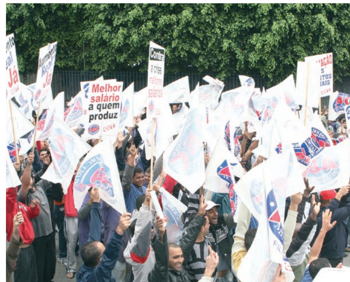
Pessoal na Resil, Terbraz e Isringhausen ficou parado até às 10h da manhã