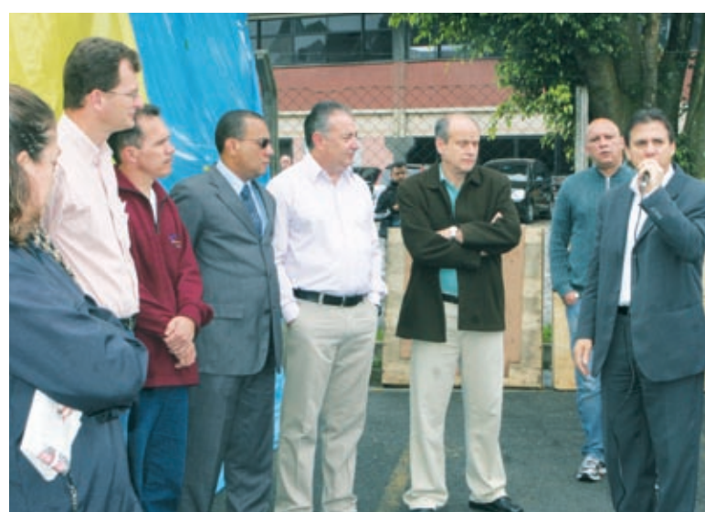
Prefeitos criticaram comportamento da direção da empresa

“Eu convoco os donos da Makita para me explicarem porque tomaram essa decisão. Nós queremos que a empresa fique na cidade e