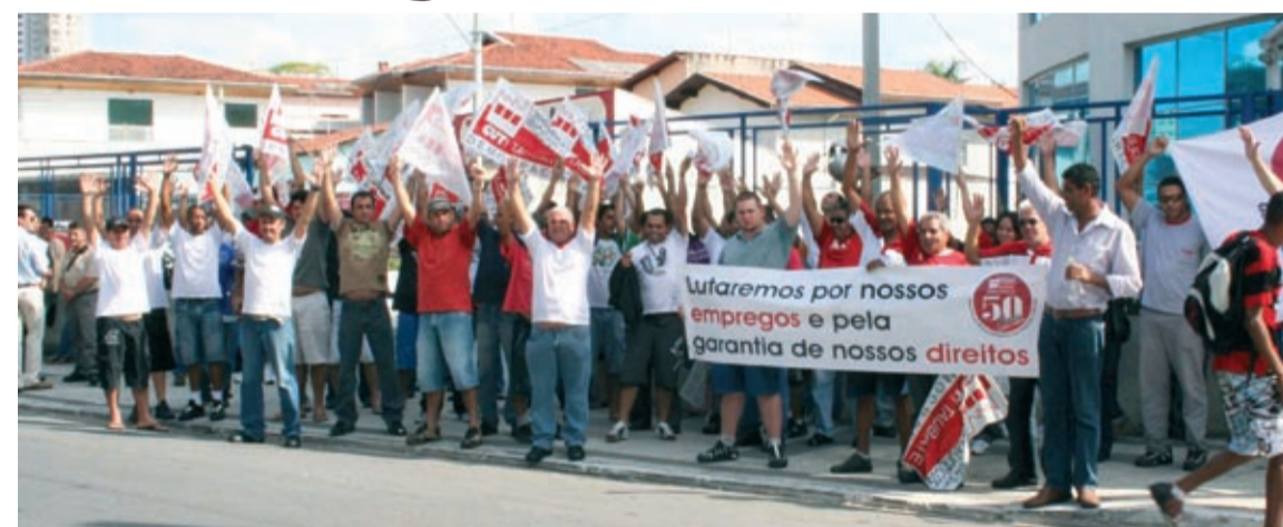
Trabalhadores na Pelzer fazem manifestação pela manutenção do emprego

O Sindicato dos Metalúrgicos de Taubaté está mobilizando a sociedade da região para evitar que cerca de mil trabalhadores diretos e indiretos percam seus empregos na Pelzer.