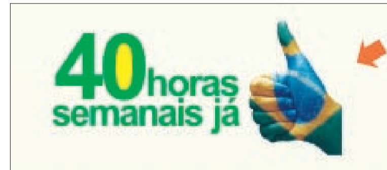
Centrais sindicais prepararam selo pela reivindicação

Na última terça-feira, o presidente da Câmara dos Deputados, Michel Temer