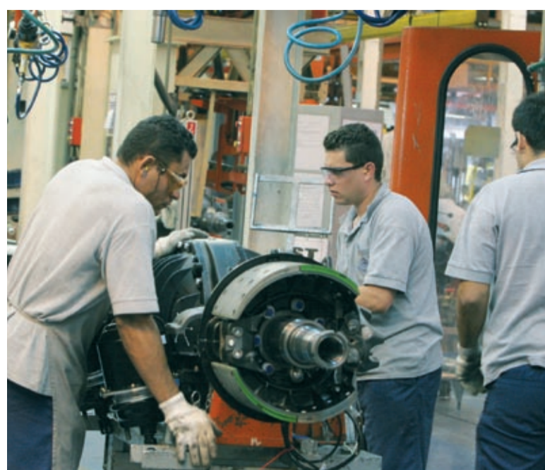
A indústria liderou a abertura de postos de trabalho

Primeiro - O ministro do Trabalho, Carlos Lupi,