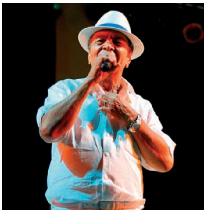
Monarco da Portela

O baile Kizomba , festa da raça, e uma roda de conversa sobre o movimento negro após o governo Lula abriram as comemorações na Sede do Sindicato. Debates e shows marcam a semana, que terá apresentações de Chico César e Monarco da Portela na sexta-feira, dia 20, em São Bernardo.