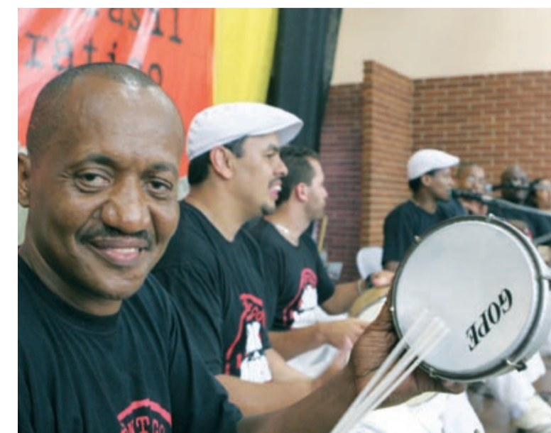
O som ficou a cargo do grupo Samba Autêntico

Ele lembrou que o feriado de 20 de novembro é importante para marcar a data que lembra Zumbi, líder do Quilombo dos Palmares. “É o único feriado com sabor de negritude no País. E Zumbi é uma referência histórica da luta e da resistência do povo negro contra a opressão”, comentou Zuza .