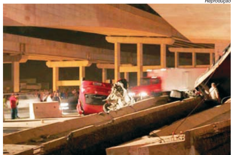
Uso de materiais mais baratos pode ser a causa do acidente da semana passada

Pelo projeto básico, as construtoras deveriam usar fundações de concreto conhecidas como tubulões para sustentar os vãos livres dos viadutos. Mas, os construtores trocaram esse material por duas mil vigas pré-moldadas mais baratas,