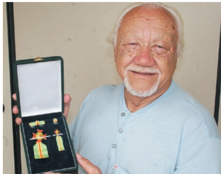
Fila mostra sua última, e mais que merecida, homenagem

Sempre na luta - Mesmo assim, não abandonou a militância e esteve junto dos metalúrgicos quando