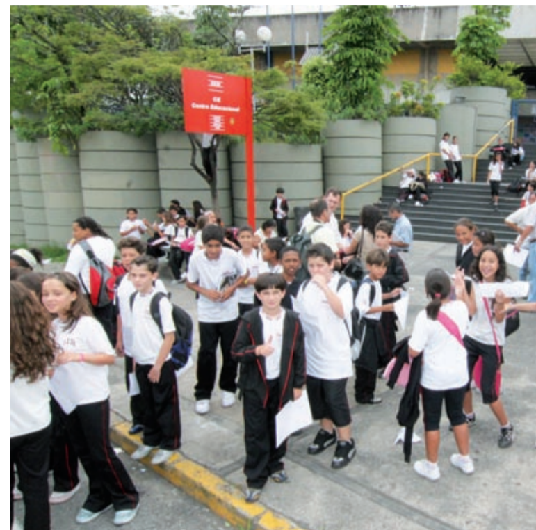
No Sesi de São Bernardo, poucas vagas e muita procura

Justiça Rafael acredita que os empresários se envolverão nessa empreitada. “Eles também têm interesse em garantir uma boa formação a mais alunos”, comentou. Hoje, a região tem 11