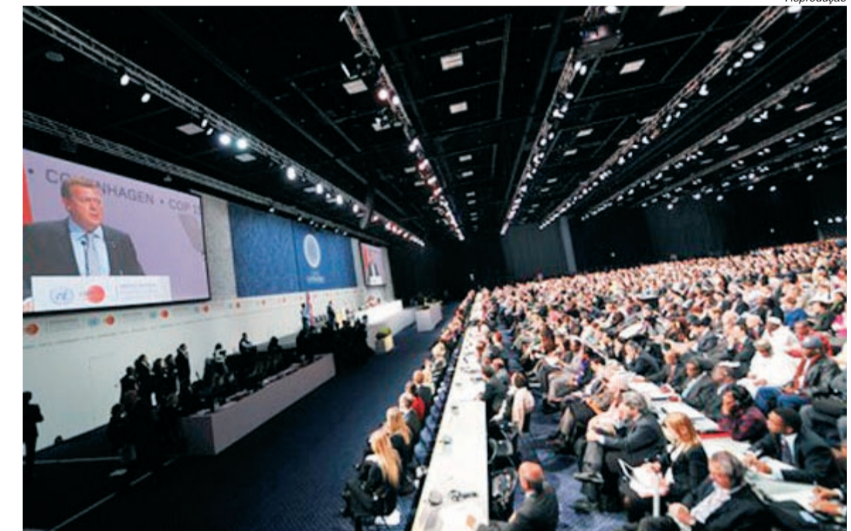
Participação dos Estados Unidos em acordo é fundamental para o sucesso da Conferência

O principal item nessa discussão é a proposta da ONU de impor aos países ricos uma redução de 20% a 45% nas emissões de gases do efeito estufa até 2020, o necessário para impedir que a temperatura da Terra suba mais do que dois graus Celsius.