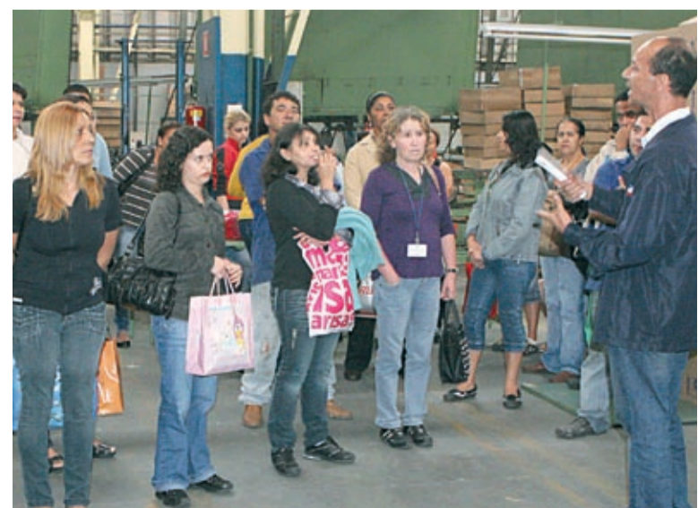
Acordo também corrigiu valor do auxílio alimentação

Os trabalhadores e as trabalhadoras na Labortub, em São Bernardo aprovaram a proposta de PLR negociada pela comissão e a empresa, em assembleia realizada na última sexta-feira. O pessoal já recebeu a primeira parcela em 30 de novembro. O último pagamento será efetuado em 30 de abril de 2010. O acordo prevê ainda reajuste no valor do auxílio alimentação a partir de janeiro.