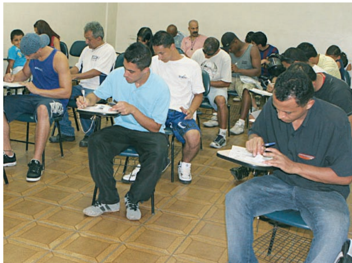
Devido à procura, Sindicato quer aumentar o número de vagas dos cursos

O segundo mais procurado foi o de Matemática, com 406 interessados. O menos procurado foi o de Comandos Elétricos com 99 inscritos.