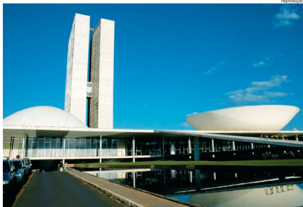
Trabalhadores querem que Congresso vote neste semestre o projeto das 40 horas semanais

“Se não houver uma definição rápida sobre a votação da matéria os empresários continuarão em-