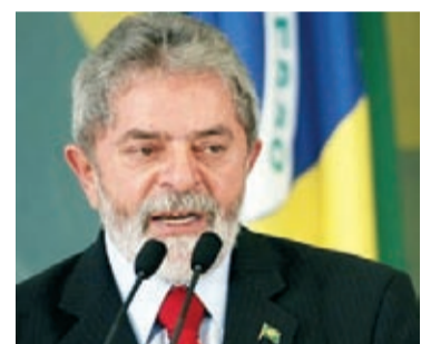
Reprodução dos confiam no presidente Lula (foto).

A avaliação positiva do governo Lula atingiu nível recorde de 75% (era 72%). Sua maneira de governar é aprovada por 83% da população e 77% dos entrevista-