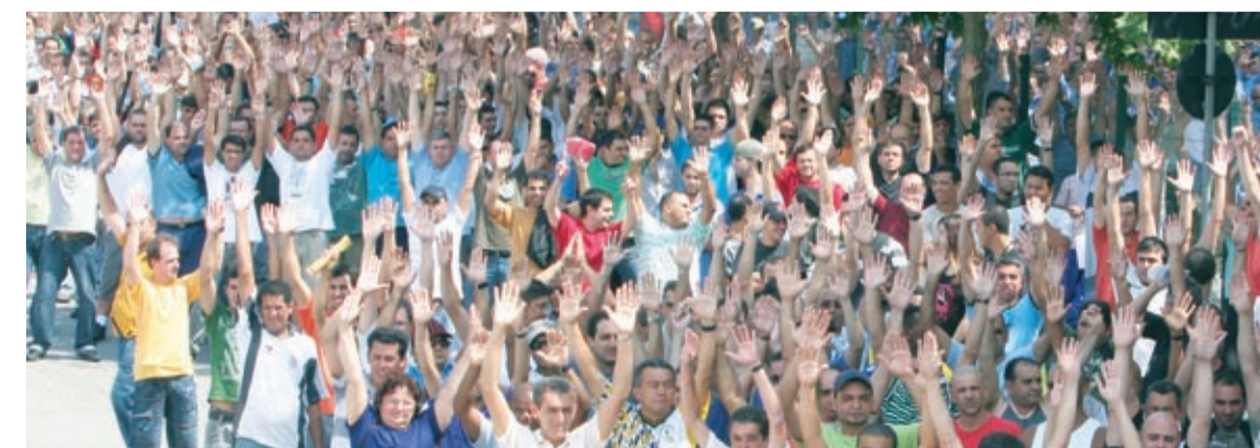
Em assembleia realizada em 2008 trabalhadores decidem sobre proposta de PLR

dúvidas, procure o departamento de Seguridade Social na Sede do Sindicato nas segundas, terças, quintas e sextas-feiras das 14h às 17h30, e nas quartas-feiras das 9h às 17h30.