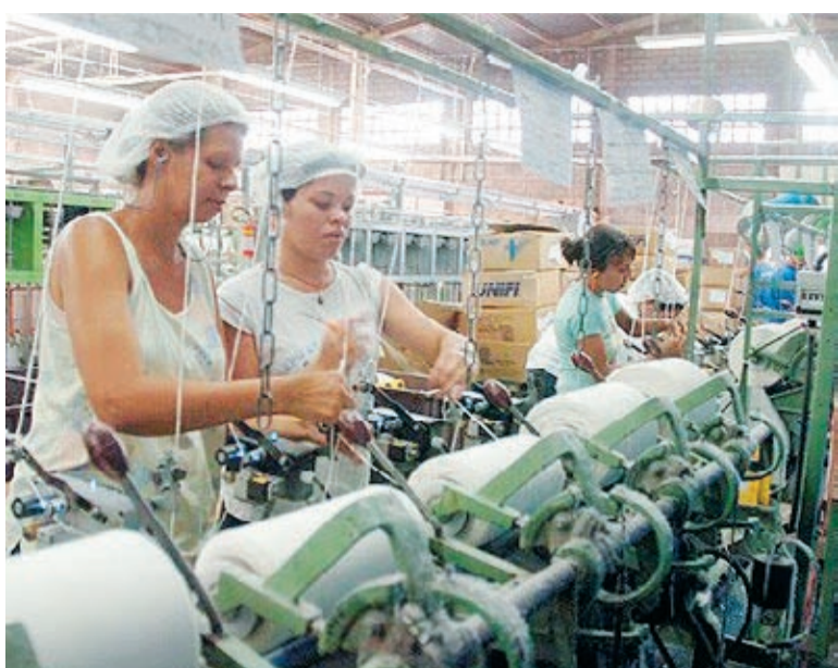
Desempenho da indústria alavancou nível de contratações

O ministro do Trabalho, Carlos Lupi, atribuiu o bom resultado de fevereiro