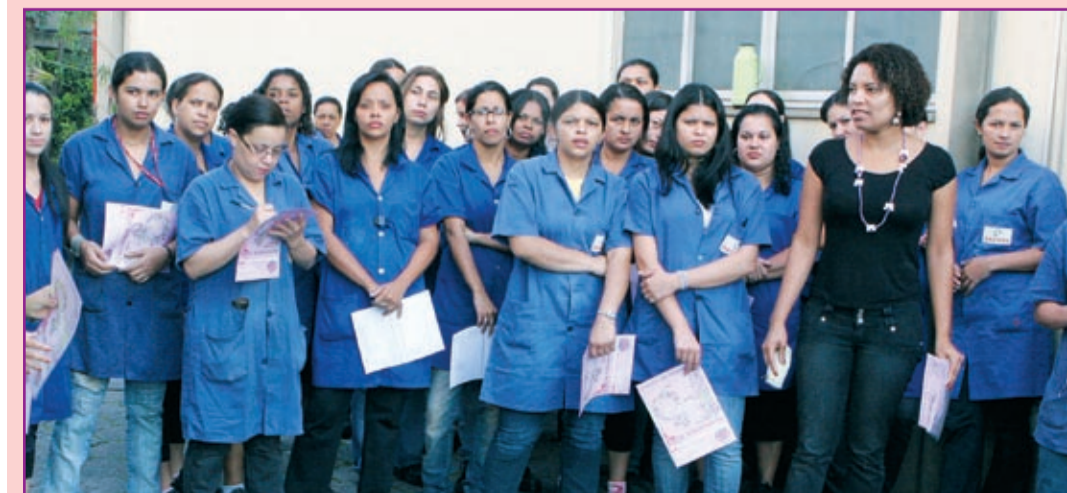
Convocação também foi feita entre as trabalhadoras na Baker

As companheiras na base atenderam o convite do Sindicato e já estão mandando suas fichas de inscrição para o 2º Congresso das Mulheres Metalúrgicas. Mande também a sua. Se ainda não recebeu, telefone para 4128-4313.