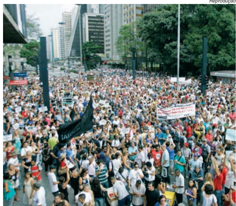
40 mil na Av. Paulista denunciaram a política do governo tucano

Os professores reclamam da inflexibilidade do governador nas negociações e da política educacional