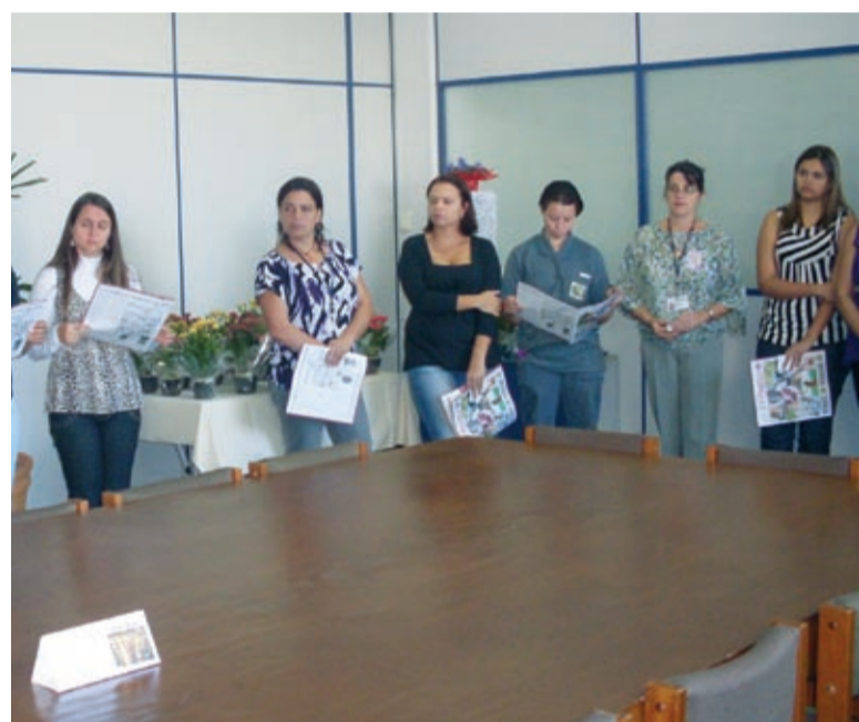
... na Uniforja