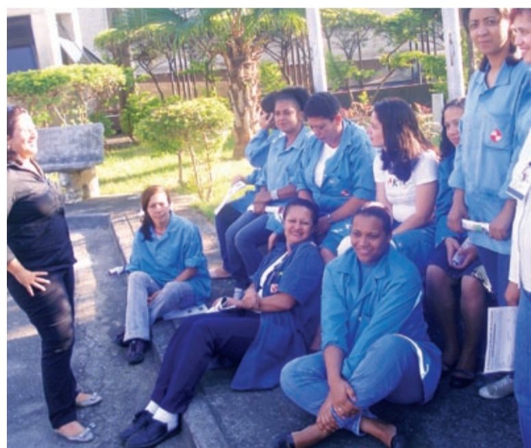
...e na Takaoka