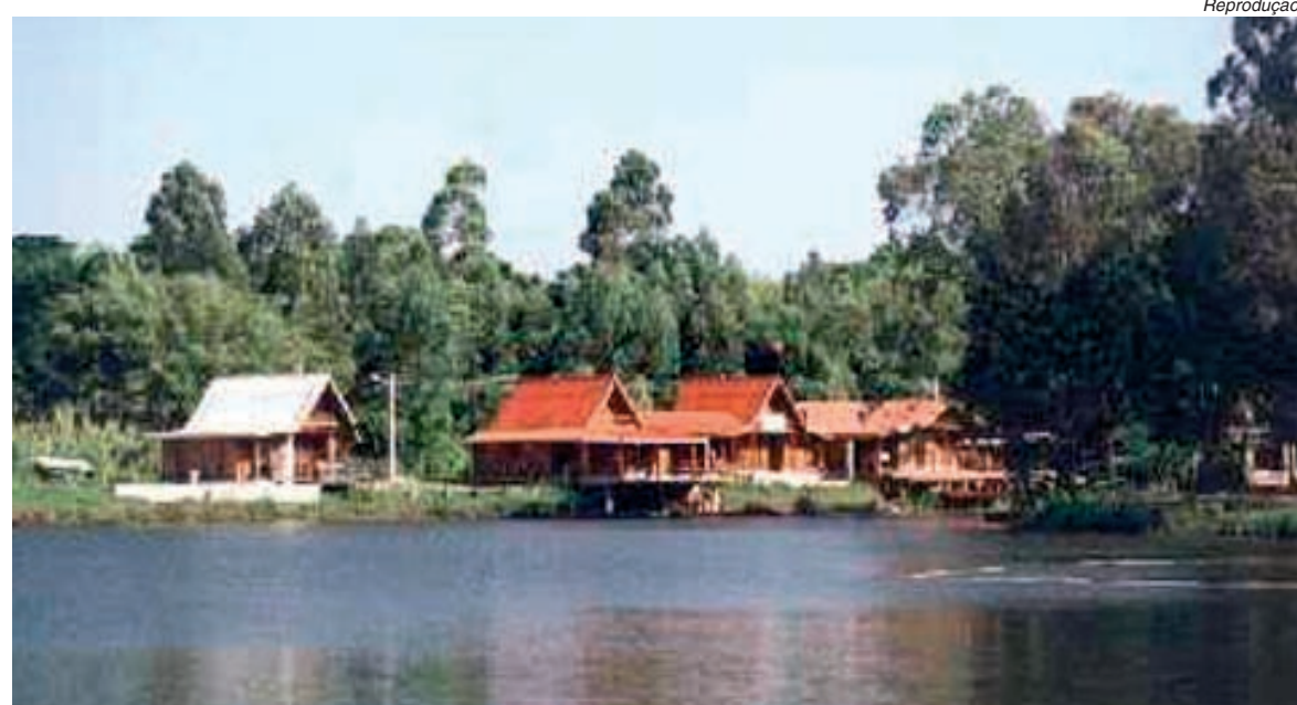
Chalés da Pousada Campo de Atibaia

Garanta seu lugar, porque os valores e a disponibilidade estão sujeitos a alterações. Veja pacotes ao lado.