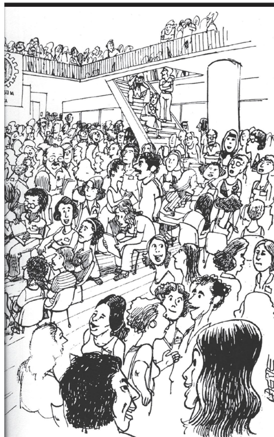
Ilustração retrata o 3º andar do Sindicato durante o encontro