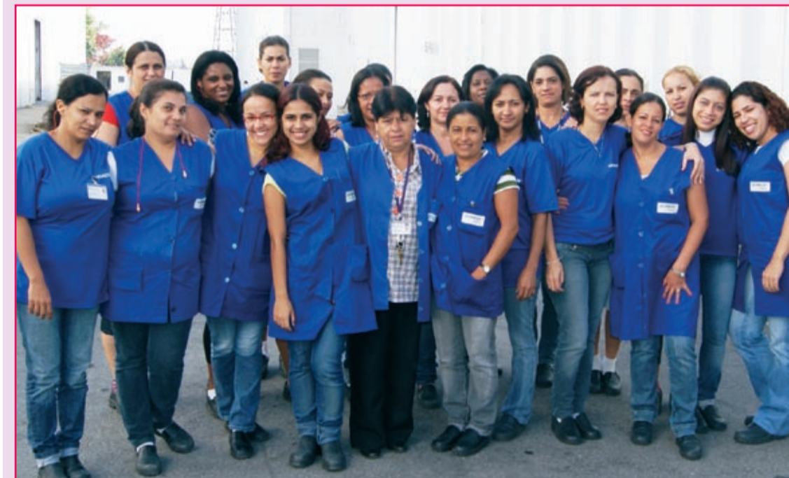
Companheiras na Papaiz se organizam para participar do Congresso

Falta apenas recolher algumas das fichas de inscrição para o encontro que será aberto nesta quinta-feira, às 16h.